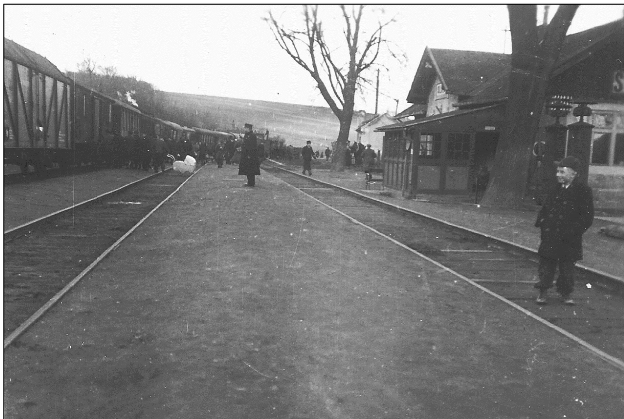
Fotka nádraží. v Silůvkách asi z roku 1935