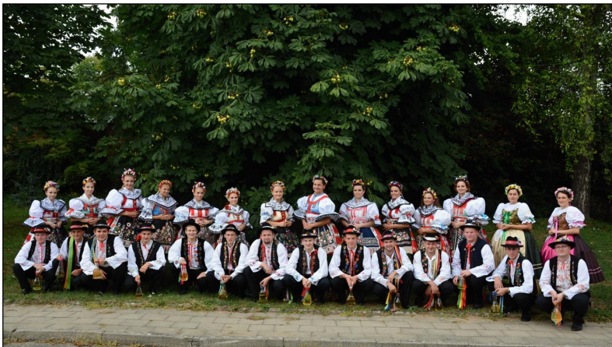
Anenské hody 2015- společné foto stárků v parku ul.Nádražní