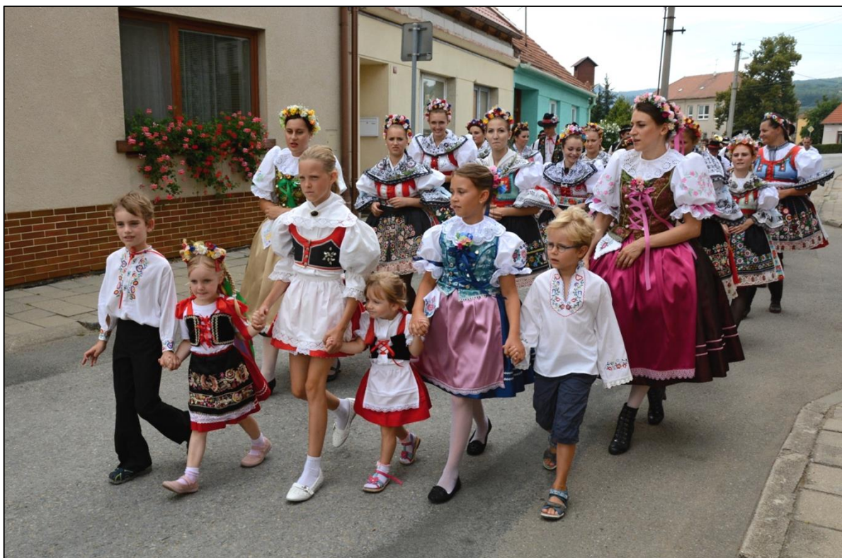
Anenské hody 2015- průvod stárků v ul. Pod Lipami