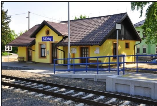
foto nádraží. v Silůvkách z roku 2014

V roce 2010 bylo kompletně opraveno silůvské nádraží. Díky spolupráci SŽDC s obcí byl zachován vzhled staniční budovy podle původní stavby. Tím se stalo jedním z nejhezčích nádraží v širokém okolí. Obec Silůvky se o něj stará, aby bylo pořád pěkné. Byl vybudován přístřešek pro čekající, přibylo vlaků. Již jednou jsme se přihlásili do soutěže o nejkrásnější nádraží. Tenkrát nám sdělili, že je nádraží příliš nové a máme se do soutěže přihlásit po nějaké době znovu. Domníváme se, že nyní nastala vhodná doba. Proto jsme se přihlásili a byli jsme odbornou porotou vybráni mezi 10 finalistů. Proběhlo hlasování a nyní očekáváme výsledky, které budou vyhlášeny 11. 11. 2015 v Senátu České republiky. Budeme se snažit vzhled a čistotu nádraží ještě vylepšit. Záleží také na vás. Udržujte čistotu, neodhazujte papírky a nedopalky. Vždyť jsou všude koše. Buďme hrdi na takové pěkné nádraží, na možnost pohodlně cestovat a važme si toho.