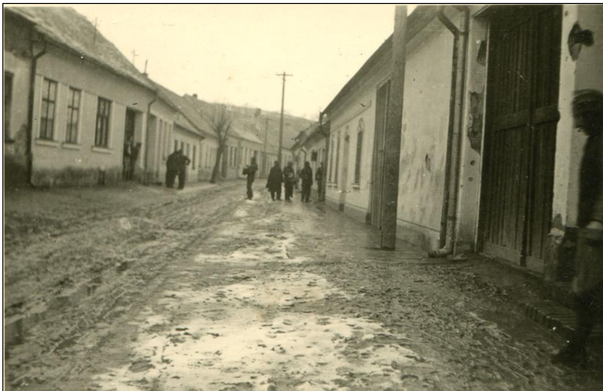
Ulice Pod Lipami