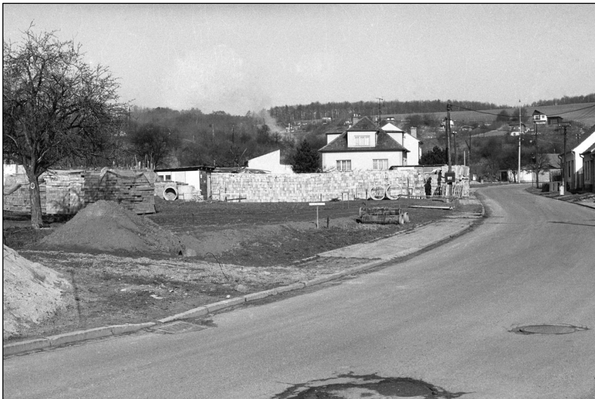
Nová výstavba na ulici Anenské