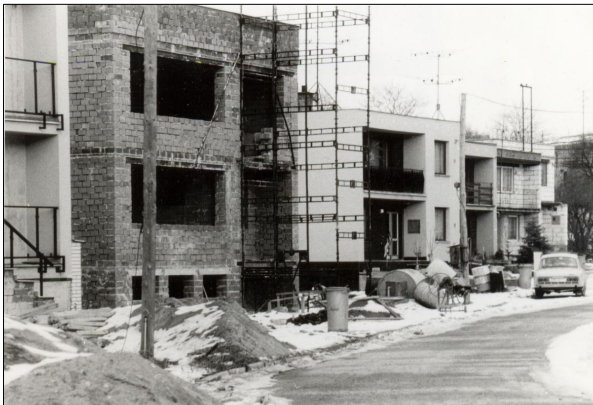
Ulice Na Rybníkách.