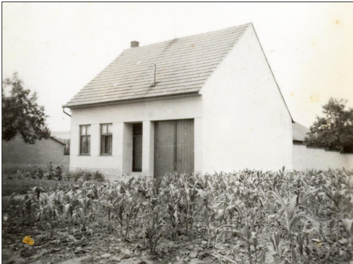
Ulice Na Nivách. Původní foto domu č. p. 205. Rodný dům Jiřího Zoufalého.