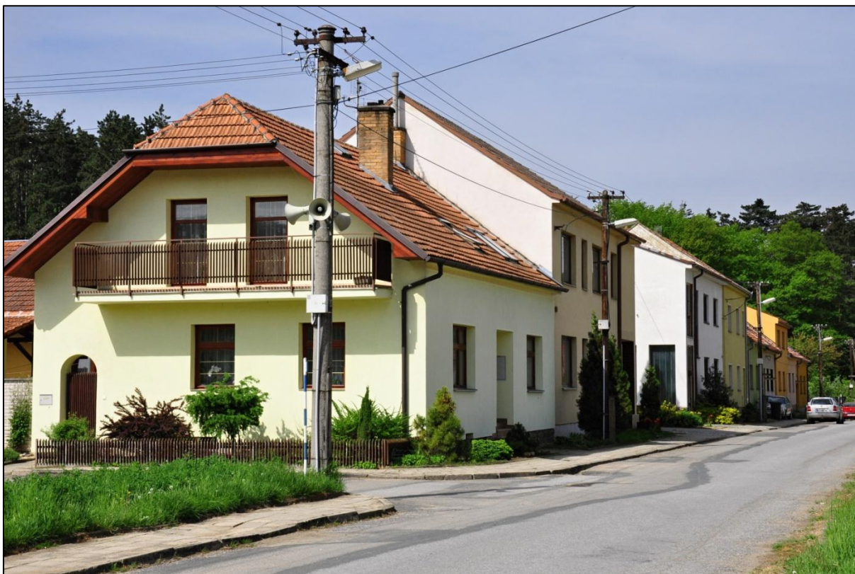
Ulice Na Rybníkách