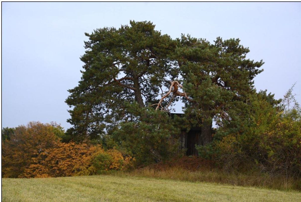
Skupina borovic lesních ( Pinus sylvestris ) na Karlově. Borovice mají košaté koruny sahající až k zemi. Jejich stáří se odhaduje přes 250 roků.