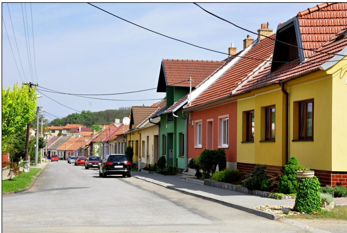
ulice Pod Lipami