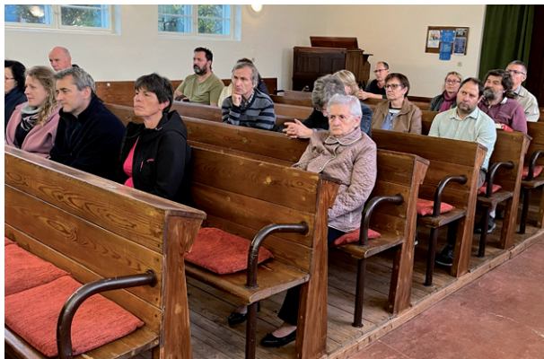
Přednáška o Janu Husovi, 22. října 2023.