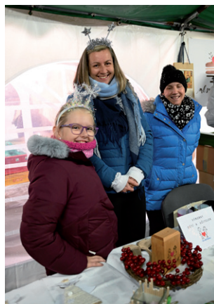
Vánoční jarmark, 2. prosince 2023.