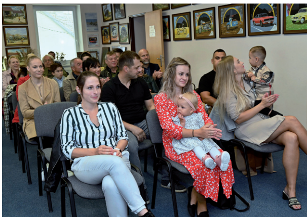
Vítání občánků, 14. října 2023.