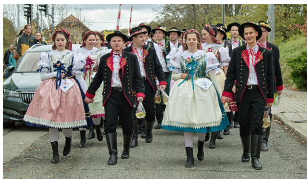
Martinské hody, 11. listopadu 2023.