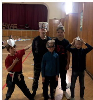
Přespávačka v sokolovně, 1. prosince 2023.