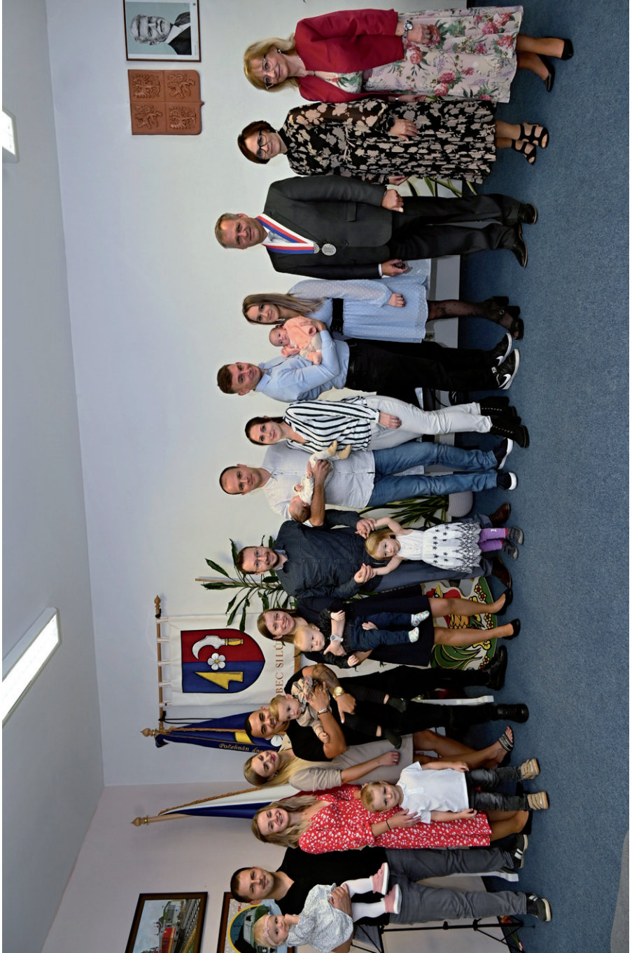
Společná fotografie nově přivítaných občanů se svými rodiči, zasedací místnost Obecního úřadu Silůvky, 14. října 2023.