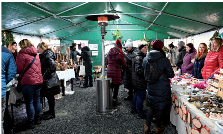
Pohled do prodejního stanu, Vánoční jarmark, 2. prosince 2023.