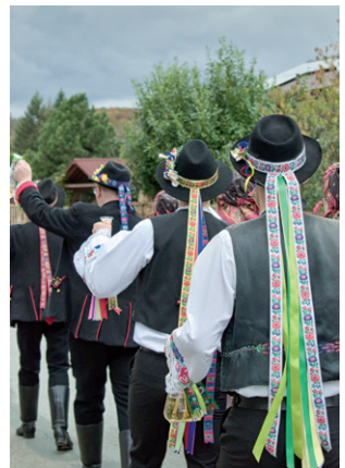
Martinské hody, 11. listopadu 2023.