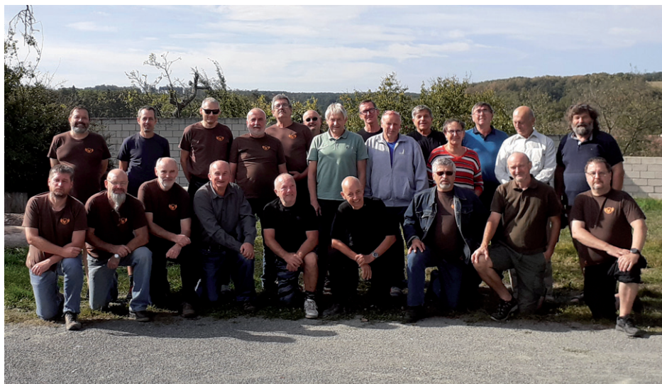
Oddílové mini jamboree, 7. října 2023.