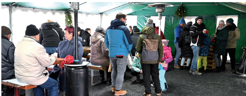
Vánoční jarmark, 2. prosince 2023.