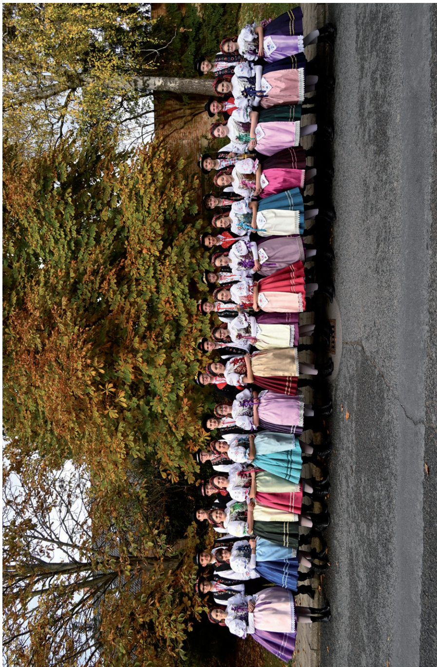
Společné foto stárků a stárků, Martinské hody, 11. listopadu 2023.