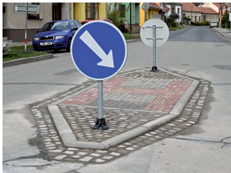
Stavba přechodu pro chodce před budovou OÚ, listopad 2023.