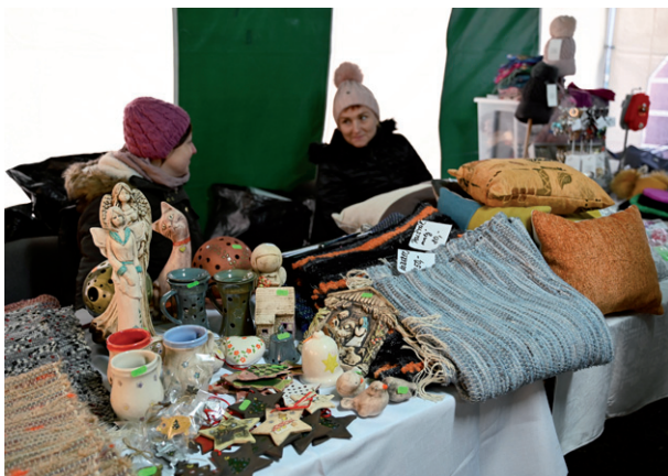
Vánoční jarmark, 2. prosince 2023.