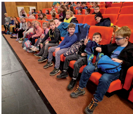
Planeta Země 3000 – Kambodža