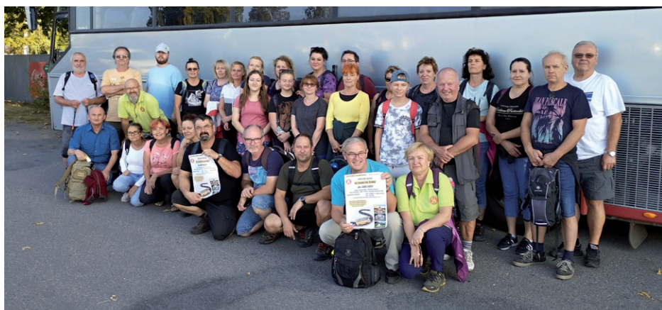
Sokolský zájezd – Ve zdaru do Žďáru, 28. září 2023.