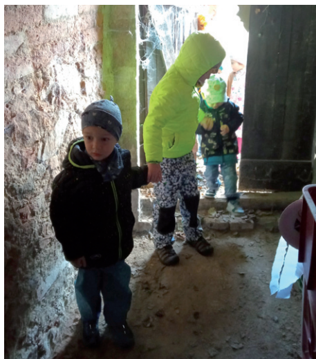
Strašidelná stezka odvahy, 6. listopadu 2023.