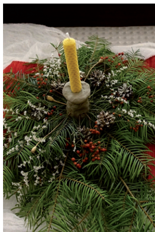
Adventní výzdoba z lesa a zahrady, 26. listopadu 2023.