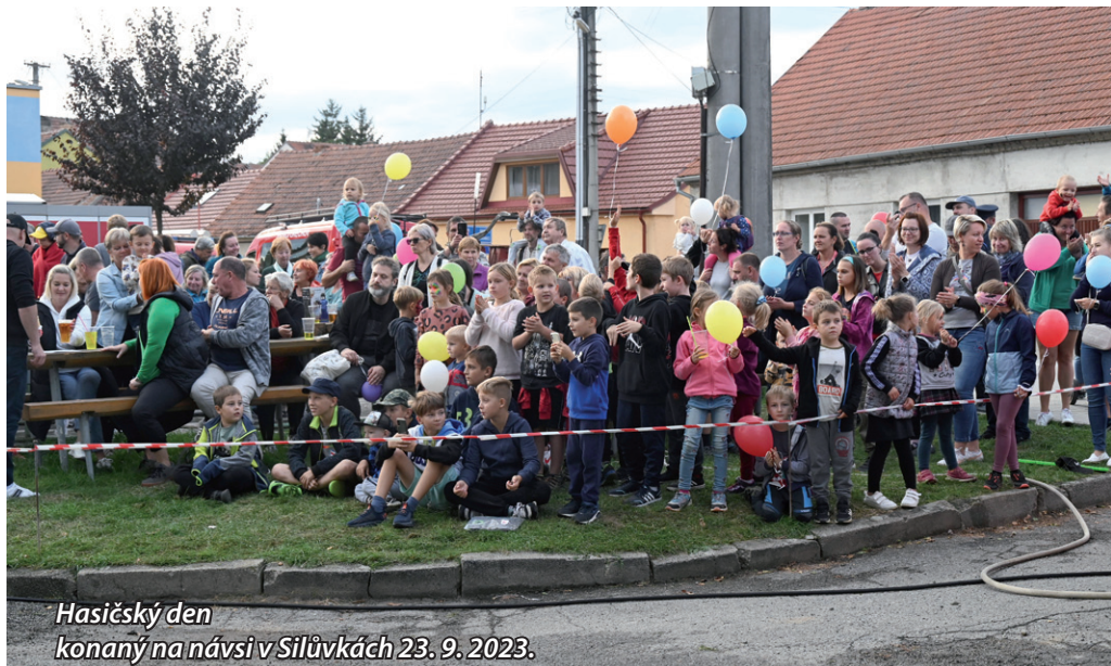
Hasičský den konaný na návsi v Silůvkách 23. 9. 2023.