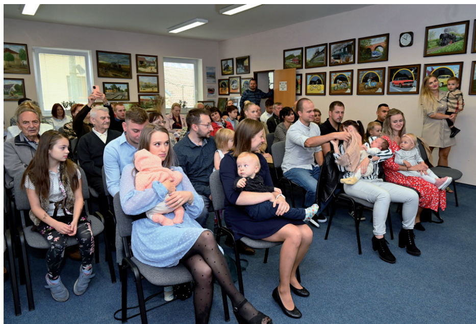
Vítání občánků, 14. října 2023.