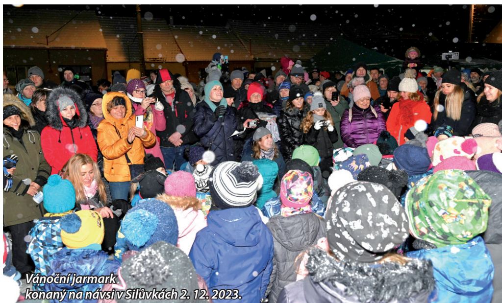
Vánoční jarmark konaný na návsi v Silůvkách 2. 12. 2023.