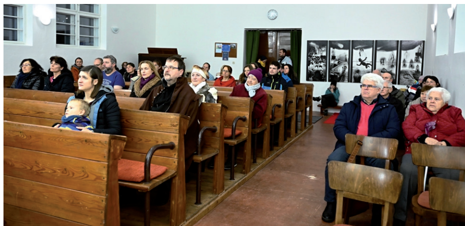
Adventní koncert, 3. prosince 2023.