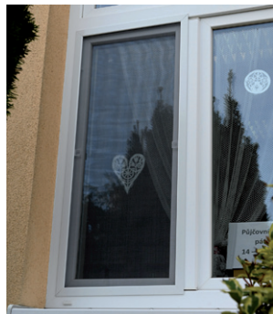
Nové sítě proti hmyzu v obecní knihovně, říjen 2023.