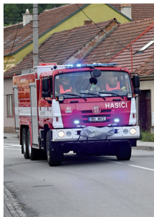
Hasičský den, 23. září 2023.