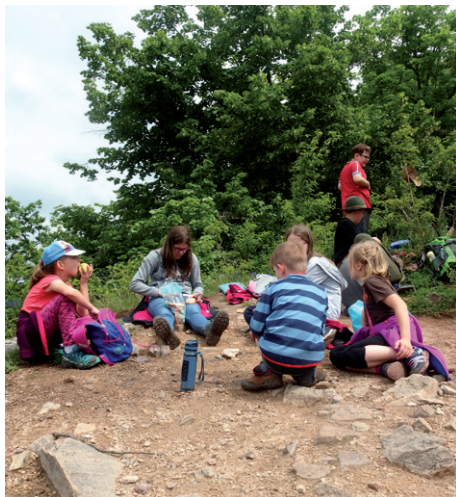
Výprava do Čučic, 24.–26. května 2024.