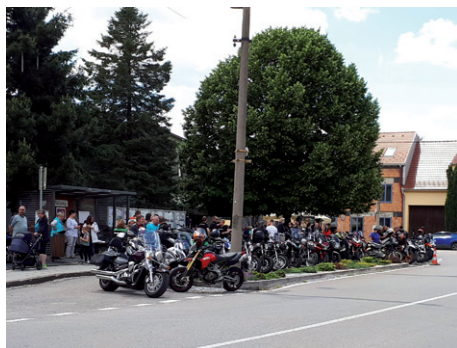
Silůvské motokolečko – XVI. ročník, 1. června 2024.