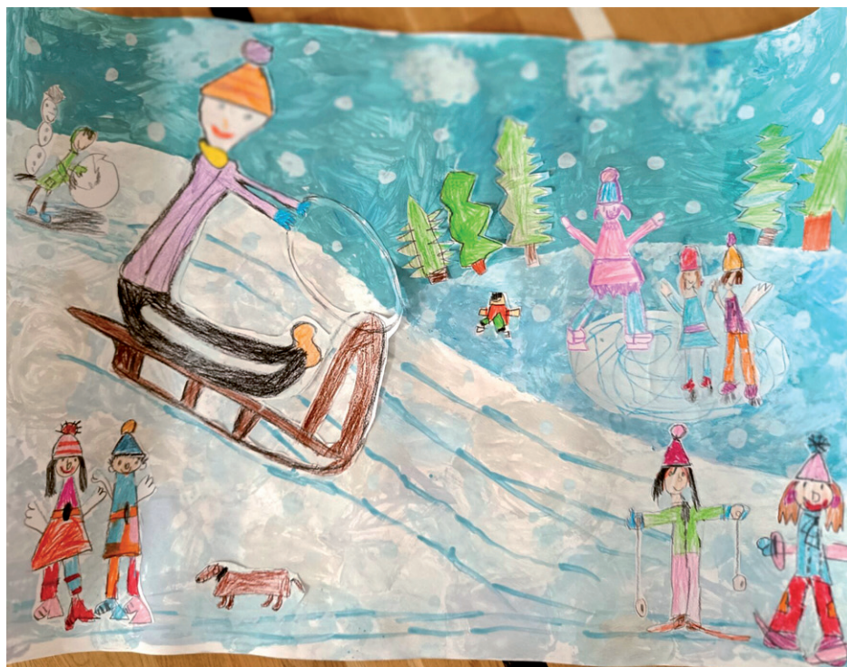
Skupinová výtvarná práce MŠ Silůvky – třída Vrabečci.