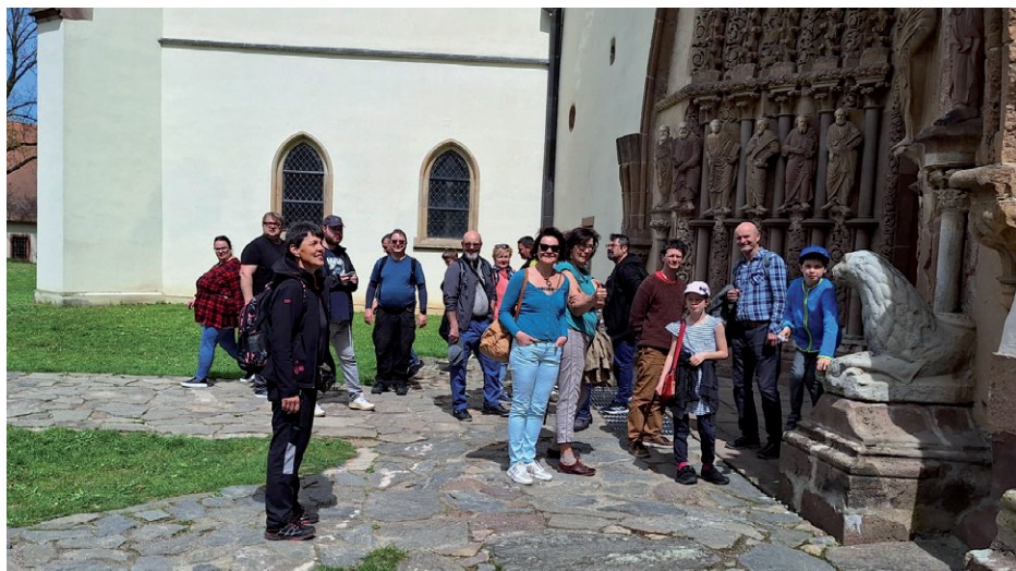
Sborový výlet do Tišnova a Předklášteří, 28. dubna 2024.