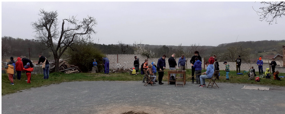
Velikonoční schůzka, 30. března 2024.