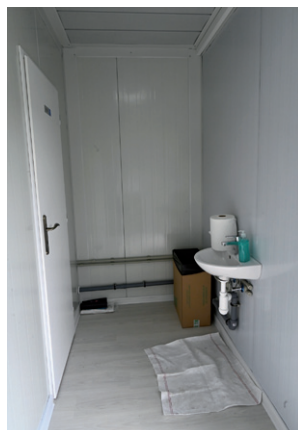
WC a šatny na hřišti Pod Lipami – zkvalitnění zázemí sportovního areálu, květen 2024.