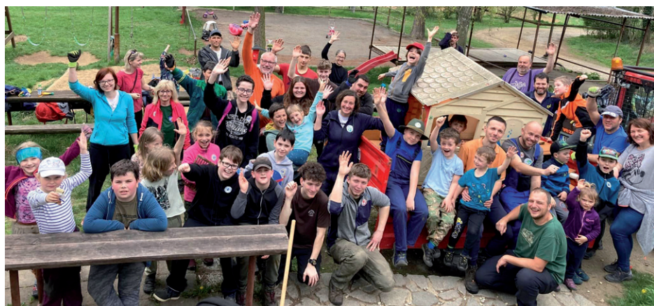
Uklidíme Silůvky a okolí, 6. dubna 2024.