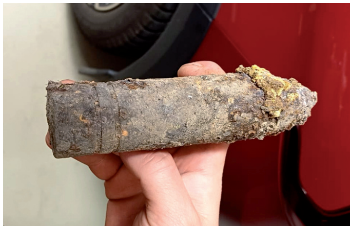
Dělostřelecký granát nalezený 2. května 2024 v 17.45 hod. při zemních pracech v zahradě domu čp. 123 na ulici Nádražní. Granát byl odvezen pyrotechnikem k likvidaci.

Odjezd vlaku taženého parní lokomotivou 354.195 „Všudybylka“ z nádraží v Silůvkách na Slavnosti chřestu v Ivančicích, 19. května 2024. Lokomotiva z roku 1925 je k vidění v Muzeu ČD v Lužné u Rakovníka.