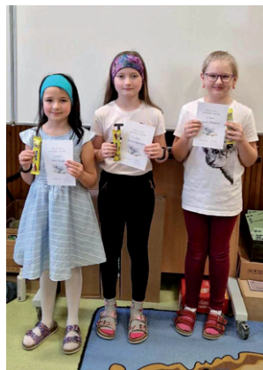
Vítězové školního kola recitační soutěže, 8. března 2024.

Za týden se tyto děti vydaly do Prštic, kde v konkurenci místních a radostických žáků opět stanuli před porotou a dětské obecnostvo.