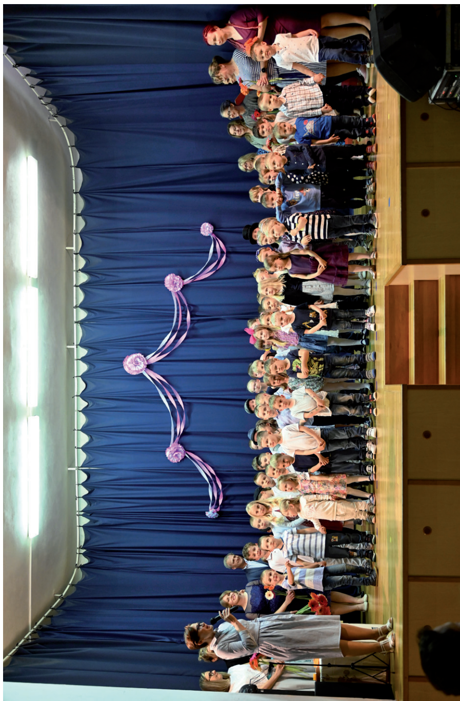
Besídka k Svátku maminek, 7. května 2024.