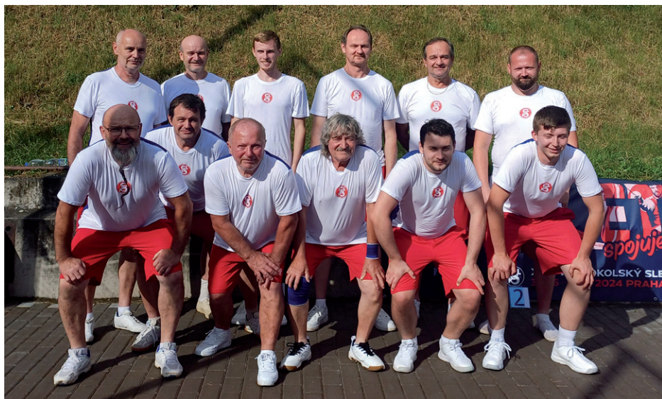
Veřejné cvičení Moravské Bránice, 1. června 2024.