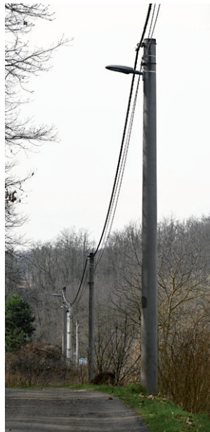
Veřejné osvětlení kolem cesty k ČOV, březen 2024.