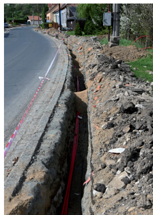
Pokládka optických kabelů, jaro 2024.