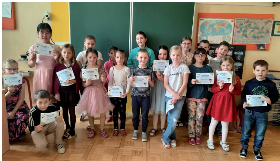
Společné foto všech vítězů pěti kategorií (1.–5. třída).