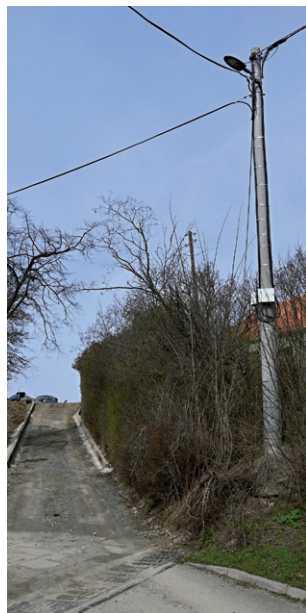
Veřejné osvětlení na konci ulice Nádražní za železničním přejezdem, březen 2024.