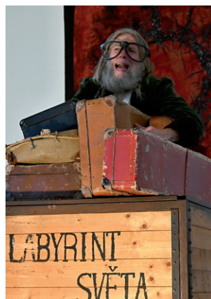
Noc kostelů, 7. června 2024.