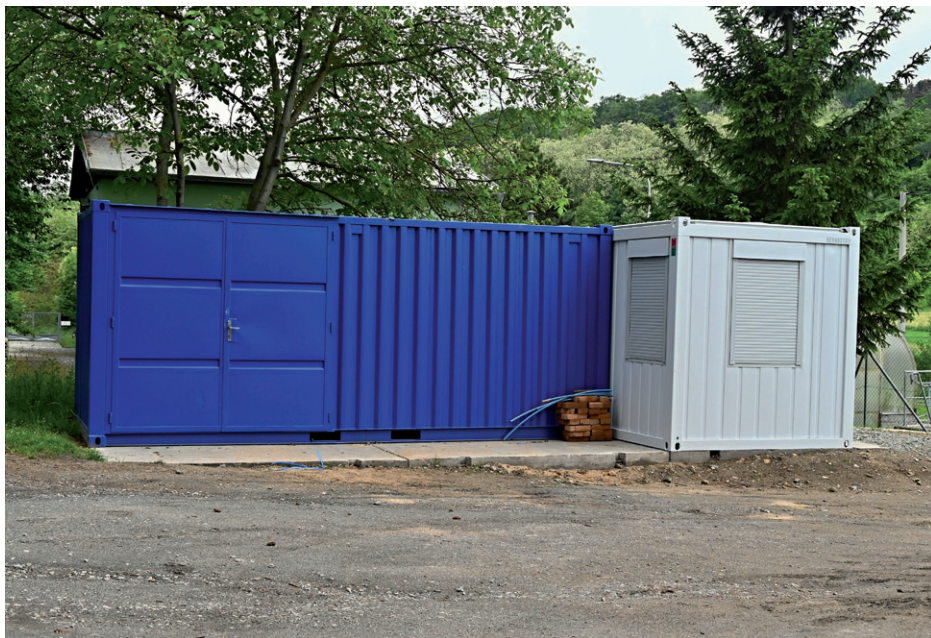
Sklad a zázemí Re-Use centra v prostorách sběrného dvora, květen 2024.