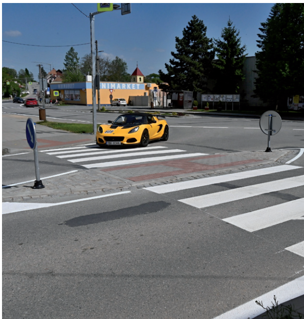
Dokončení přechodu pro chodce před OÚ, duben 2024.