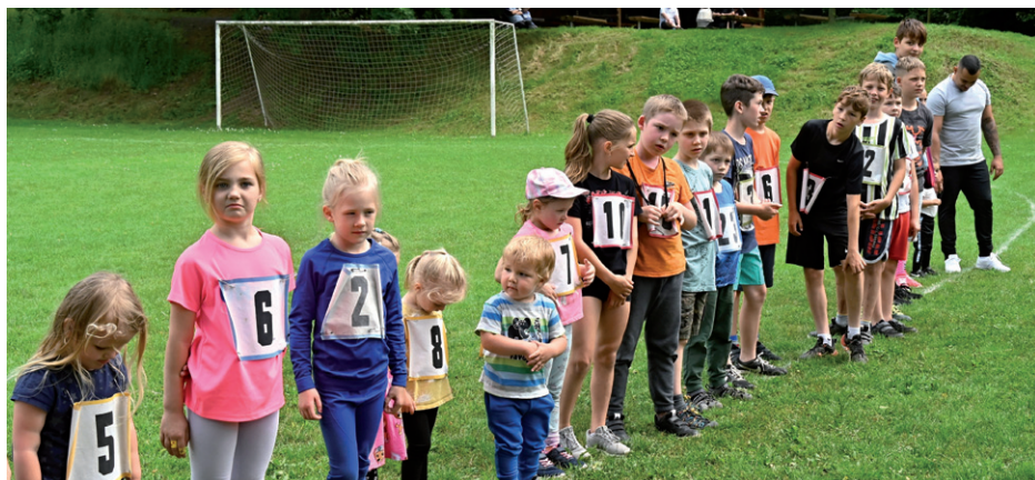
Atletický čtyřboj, 2. června 2024.