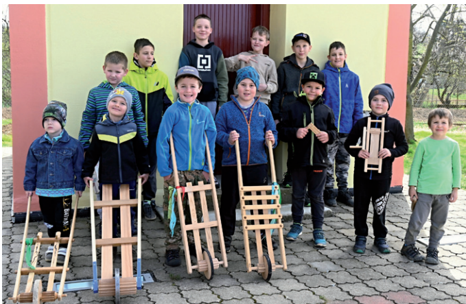
Velikonoční hrkání, 29. března 2024.