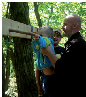
Ninja Faktor, 27. dubna 2024.