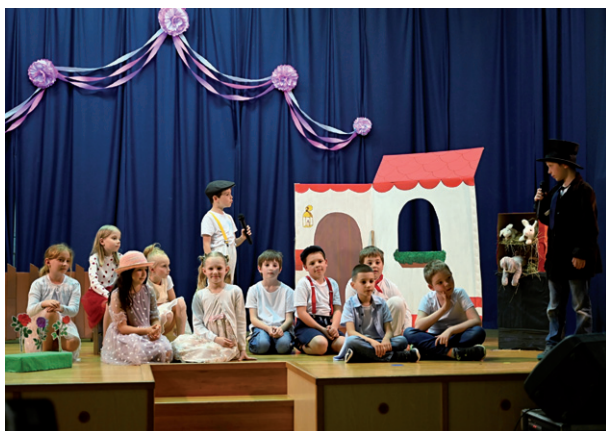
Besídka k Svátku maminek, 7. května 2024.