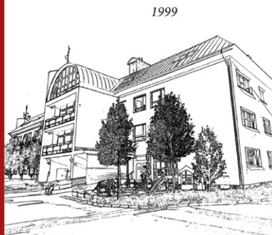
Dům léčby bolesti s hospicem sv. Josefa