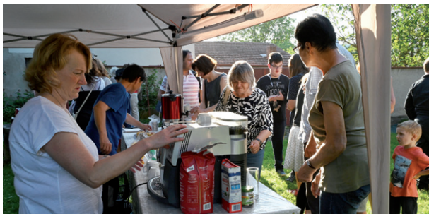
Noc kostelů, 7. června 2024.