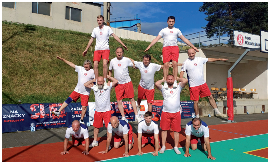
Veřejné cvičení Moravské Bránice, družstvo mužů T. J. Sokola Silůvky, 1. června 2024.