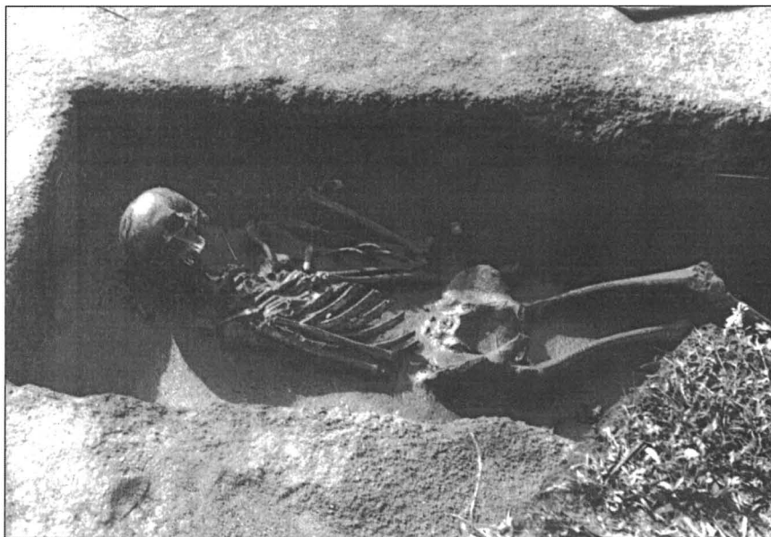
Jedna z obětí třicetileté války pohřbená pod kaštanem na Prachatickách

Na paměť významných událostí postavila obec i jednotlivé rodiny během věků památníky, které tyto události nejen datují, ale také po léta znovu připomínají. Nemůže být řeč o kulturním národu, pokud dopustí tyto monumenty zneuctívat, poškozovat, či dokonce svévolně ničit.