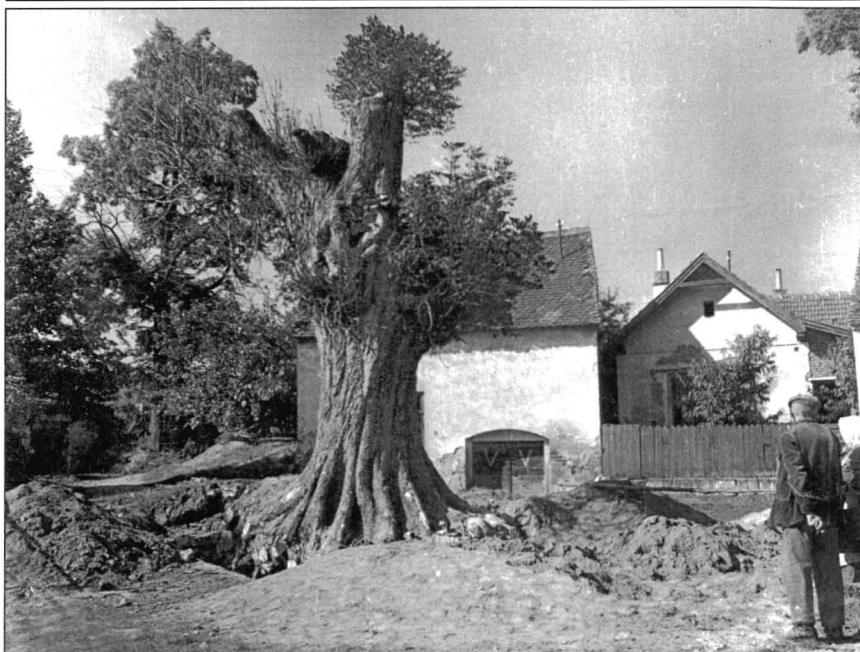
Kaštan na Prachatickách