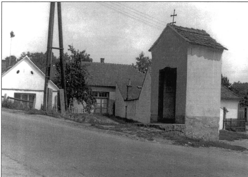
Kaple sv. Jana