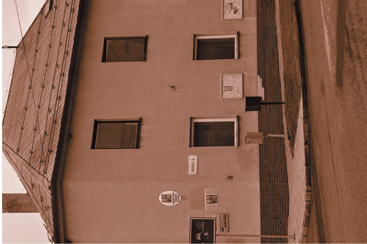
> Obecní úřad č.p. 39, 2010