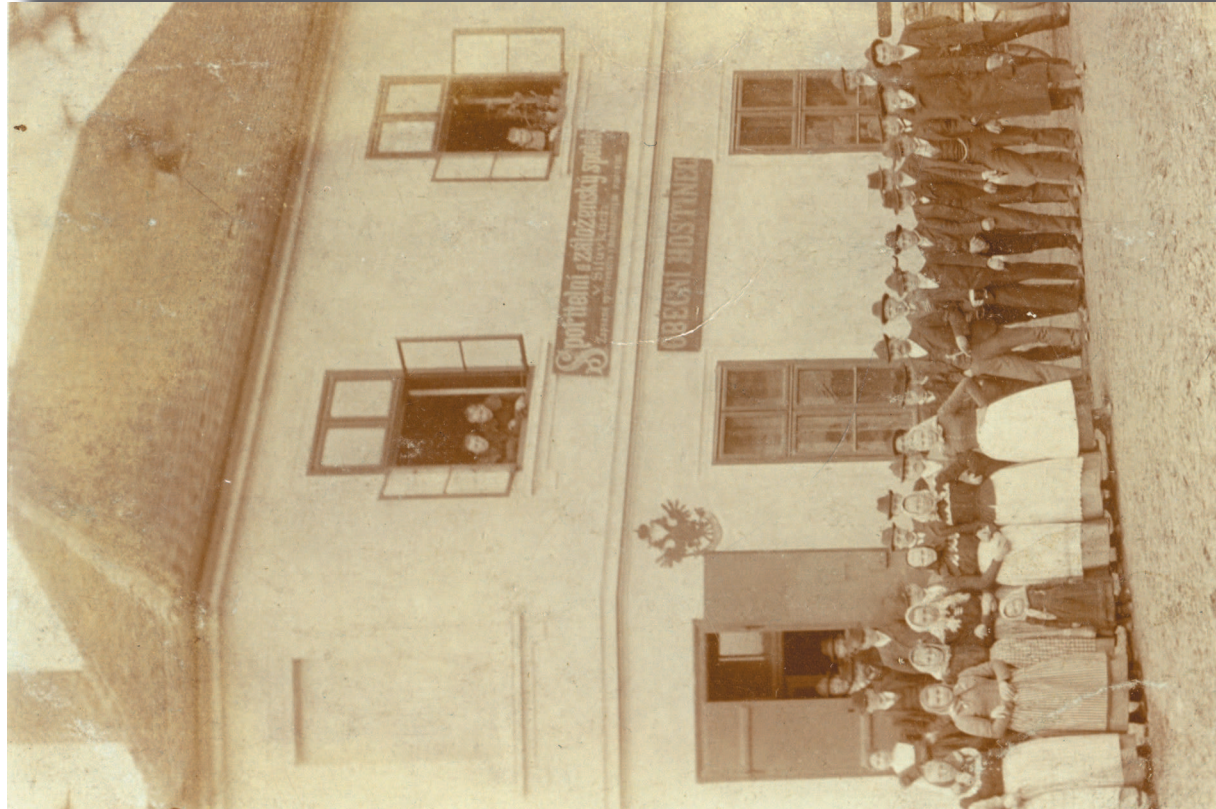
< Obecní hostinec č.p. 39, 1900