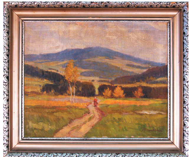
Anastas Procházka – Na cestě