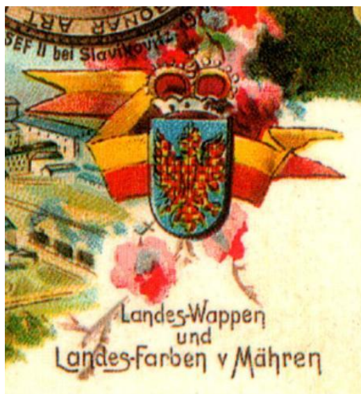
Zemské barvy a znak Moravy, 1900

Dnešní hojně rozšířená podoba moravské vlajky vychází ze zemských barev, zlaté a červené, kterých se od počátku 19. století používalo k výzdobě, později začaly být vyvěšovány i jako prapory. Oficiálního stvrzení se dočkaly v roce 1848, kdy poslanci Moravského zemského sněmu schválili 5. článek nové moravské ústavy, ve kterém se definuje zemský znak a zemské barvy: „ Země moravská podrží dosavadní svůj erb zemský, totiž orlici vpravo hledící, v poli modrém a červenozlatě kostkovanou. Zemské barvy jsou zlatá a červená. “ Od stanovených zemských barev byla následně odvozena moravská vlajka, kterou tvoří dva vodorovné pruhy. Horní pruh je žlutý, spodní je červený. V druhé polovině 19.