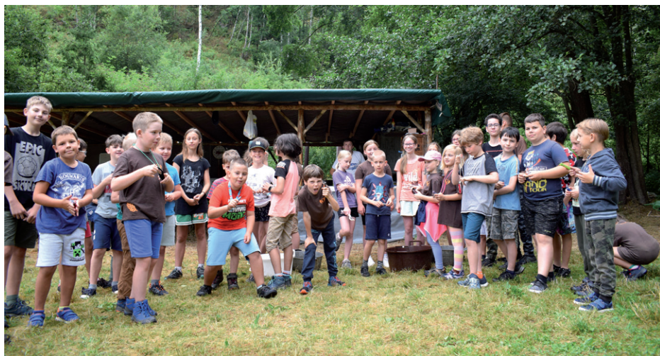
Tábor oddílu Sokolík, Ocmanice 2024.