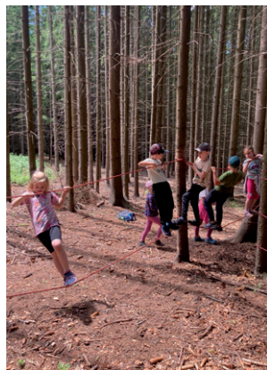
Indiáni – stezka přežití, 7. června 2024.