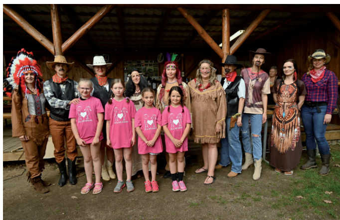
Loučení s třeťáčkami, 20. června 2024.