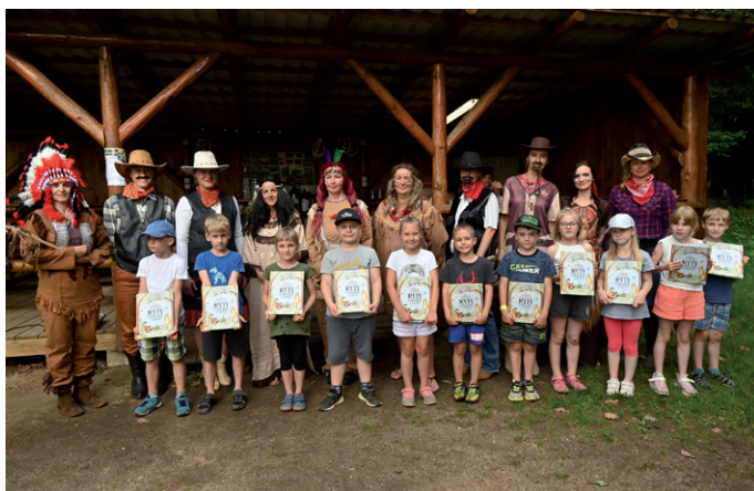
Pasování prvňáčků na čtenáře, 20. června 2024.