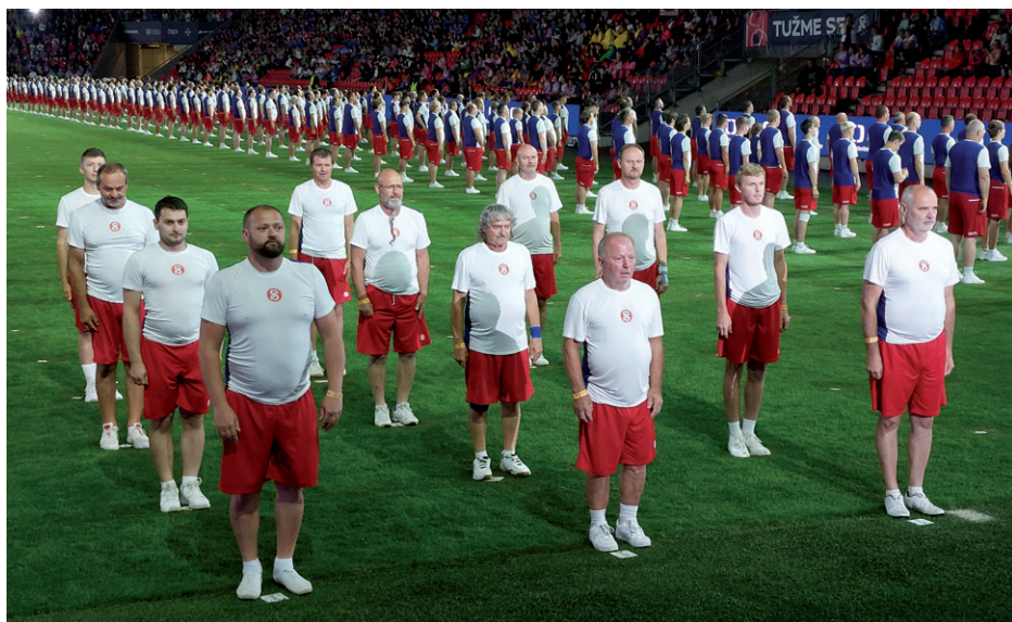
XVII. všesokolský slet Praha, skladba Před kamerou, družstvo mužů z T. J. Sokol Silůvky.