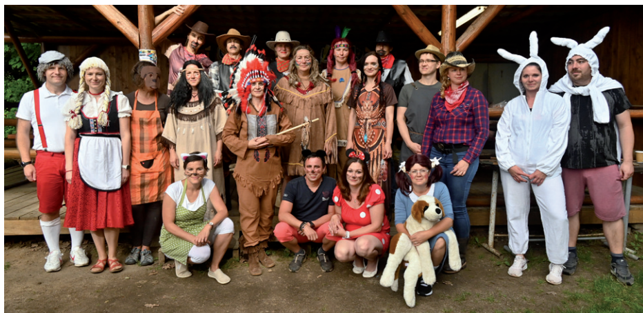
Pohádkový les, 20. června 2024.