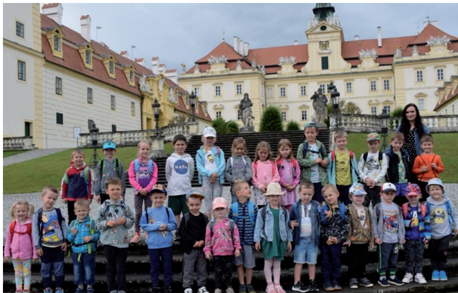
Žáci MŠ Silůvky před zámkem ve Valticích, 10, června 2024.

Konec školního roku bývá pestrý na různé akce, výlety, programy, soutěže. Co všechno děti zažily, čeho se zúčastnily, kam se podívaly, si můžete prohlédnout na webových stránkách školy: zamssiluvky.edupage.org