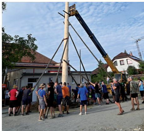
Stavění máje, 26. července 2024.