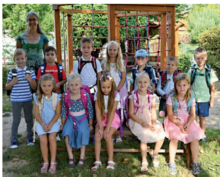
Zahájení školního roku, 2. září 2024.