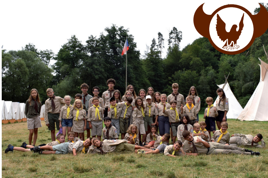
Společná fotografie účastníků tábora oddílu Sokolík, Ocmanice 2024.