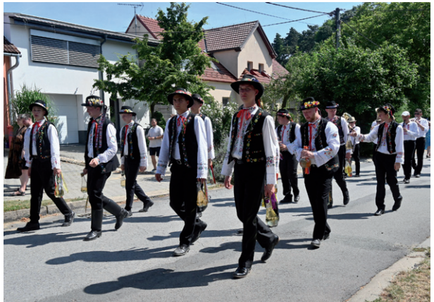
Anenské hody, 27. července 2024.