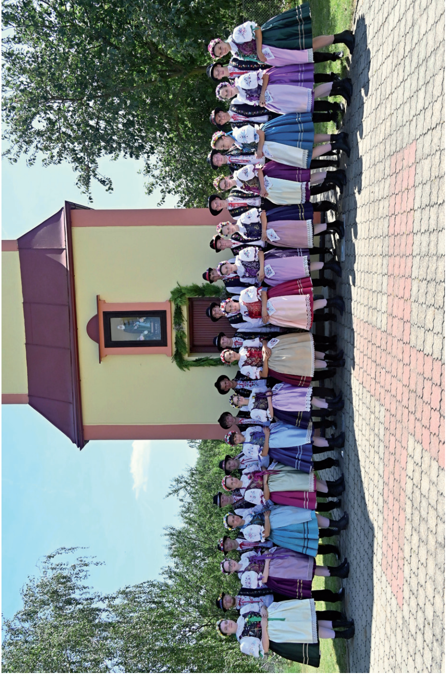
Společné foto stárek a stárků, Anenské hody Silůvky, 27. července 2024.