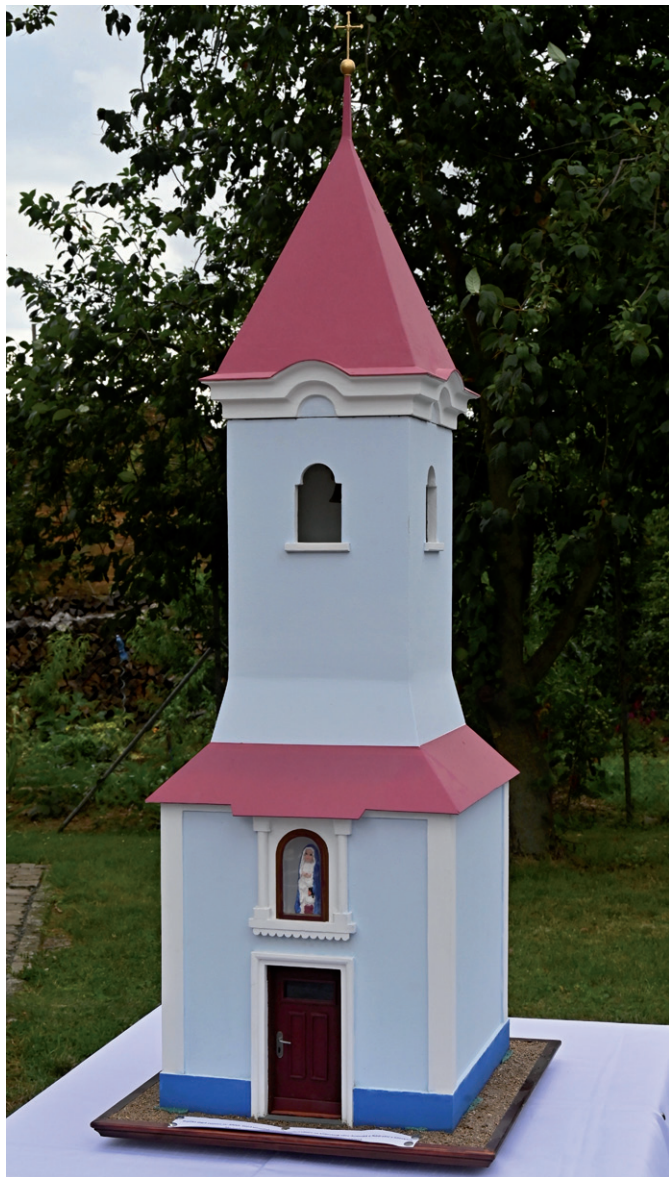
Model původní zvonice sv. Anny zhotovený Jiřím Zoufalým v měřítku 1:10. Tato zvonice stála v letech 1850–1973 na křižovatce ulic Anenské a Nádražní.