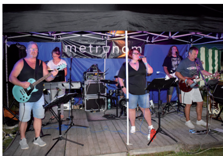
Silůvský pivní mikrofestival, 11. ročník, 24. srpna 2024.