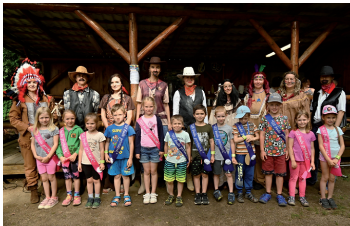
Pasování předškoláků na školáky, 20. června 2024.