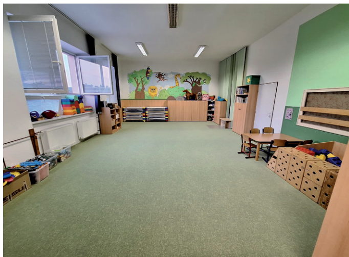
Nový koberec v prostorách MŠ.