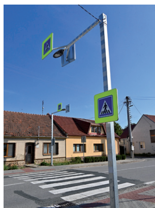
Osvětlení přechodu pro chodce na ulici Sokolské před Minimarketem.