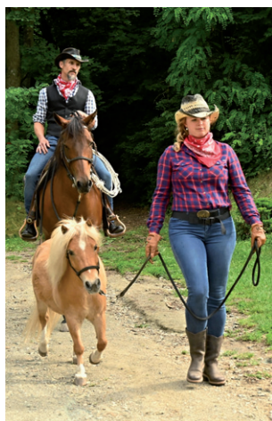
Pasování, 20. června 2024.