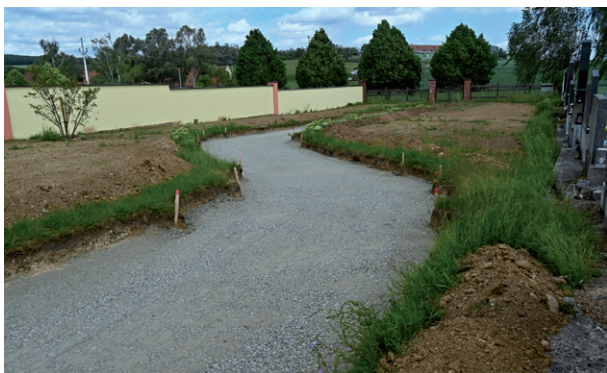
Přípravné práce k vybudování cesty a výsadba zeleně v nové části hřbitova.