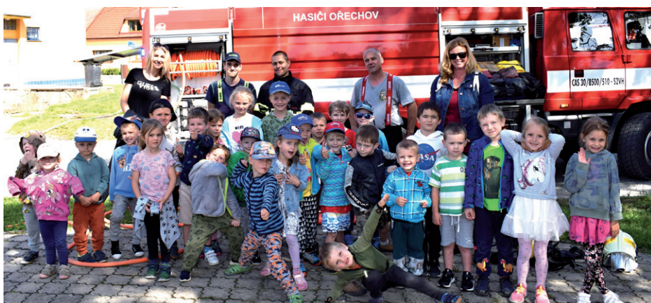
Cvičný požární poplach, 21. června 2024.