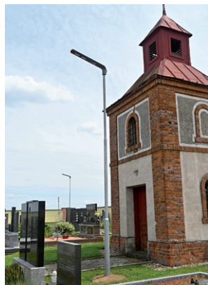
Instalace solárního led osvětlení v prostorách hřbitova, červen 2024.