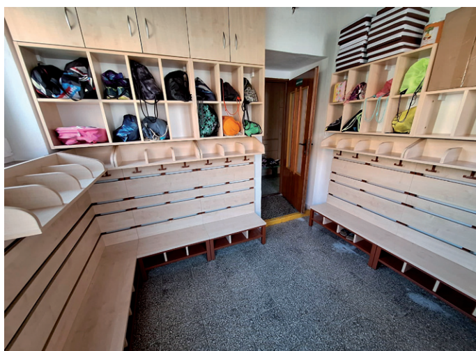
Šatna pro spodní třídou ZŠ.