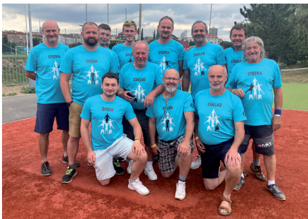
XVII. všesokolský slet, Praha 2024.