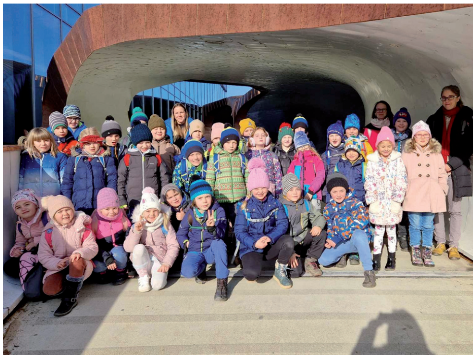
Návštěva VIDA science centra, 30. ledna 2025.