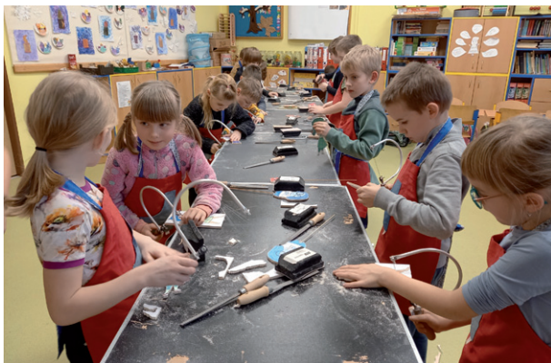
Tvoření z balsy, 23. ledna 2025.