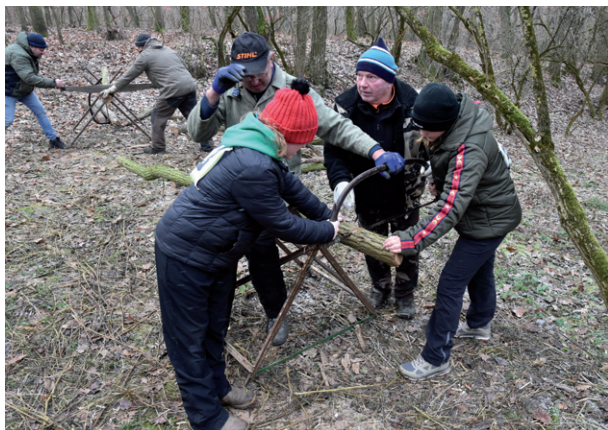
Zimní stopou okolo Silůvek, 11. ledna 2025.