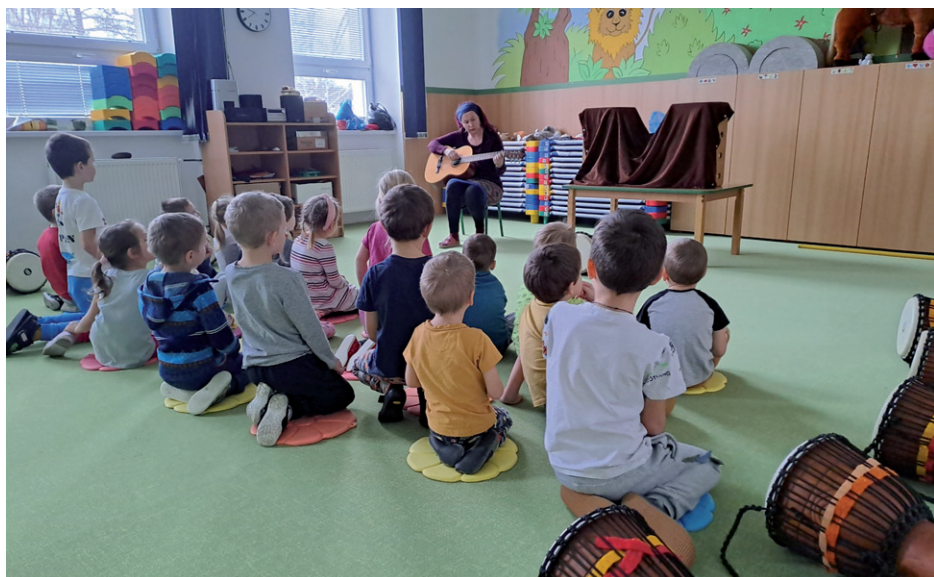
Divadélko a bubnování v MŠ.