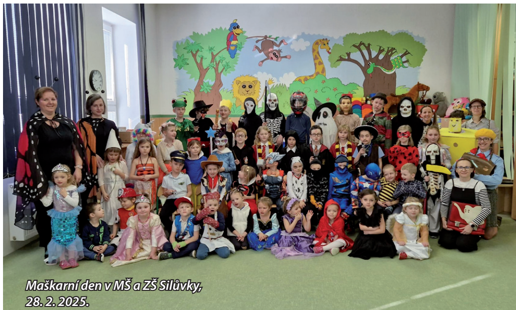
Maškarní den v MŠ a ZŠ Silůvky, 28. 2. 2025.