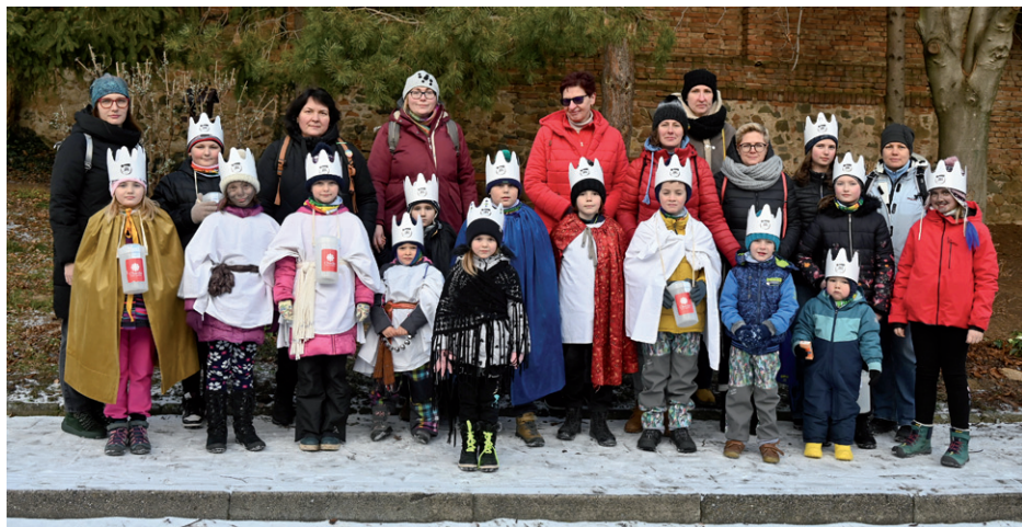
Společné foto koledníků Tříkrálové sbírky, 4. ledna 2025.