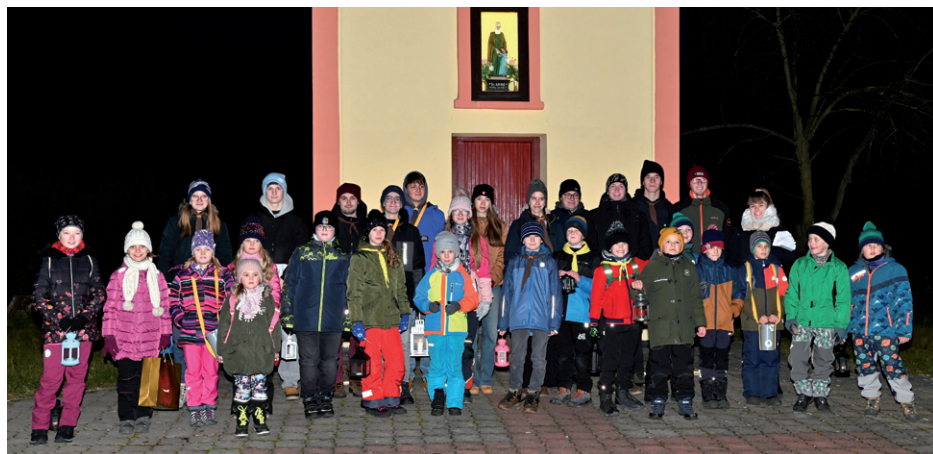
Členové skautského oddílu Sokolík při roznášení Betlémského světla, 23. prosince 2024.