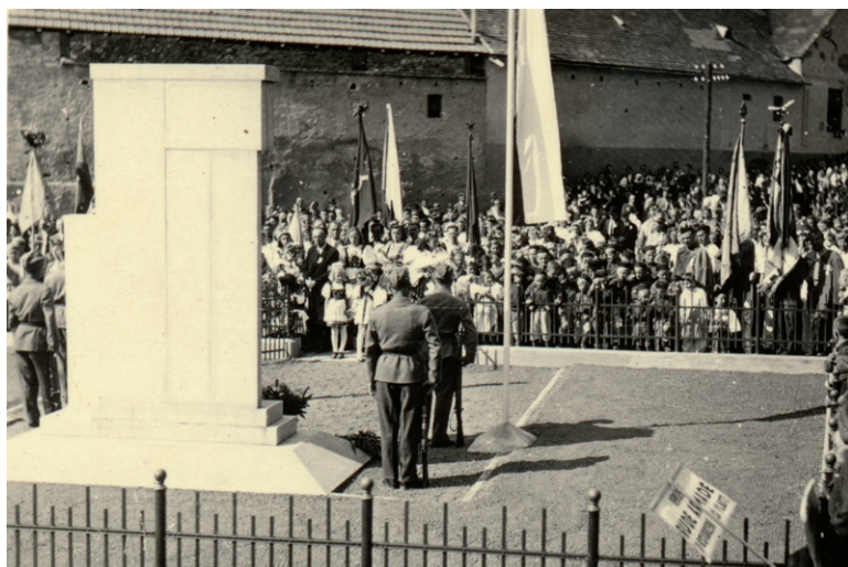
V letošním roce si připomínáme 80. výročí konce 2. světové války. Naše obec byla osvobozena 18. dubna 1945. Na fotografii slavnostní shromáždění občanů k 1. výročí osvobození obce Silůvky a znovuodhalení opraveného Památníku osvobození, 5. května 1946.