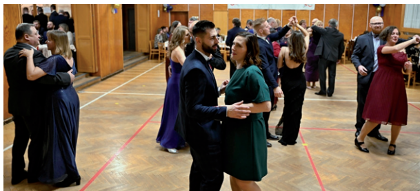
Reprezentační ples T. J. Sokol Silůvky, 18. ledna 2025.