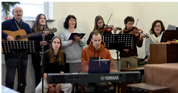
Štědrovečerní bohoslužba s dětskou vánoční hrou, 24. prosince 2024.