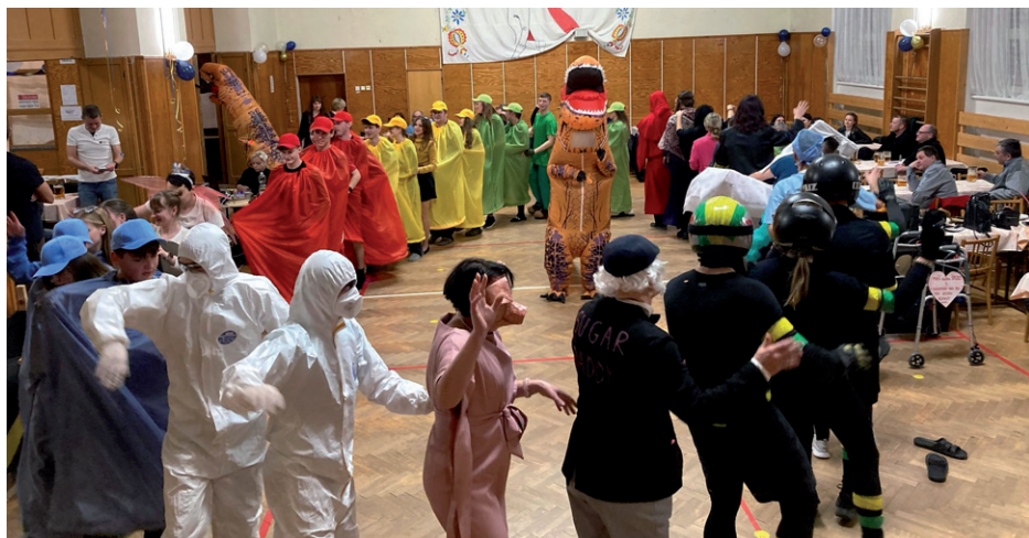
Rockové maškarní ostatky, 22. února 2025.