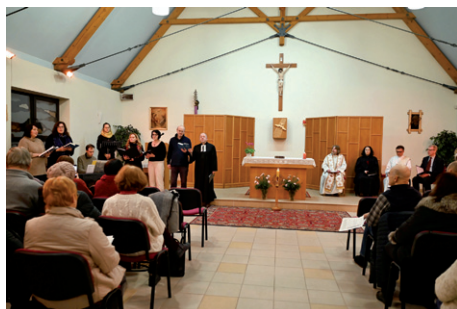
Ekumenická bohoslužba, 27. ledna 2025.