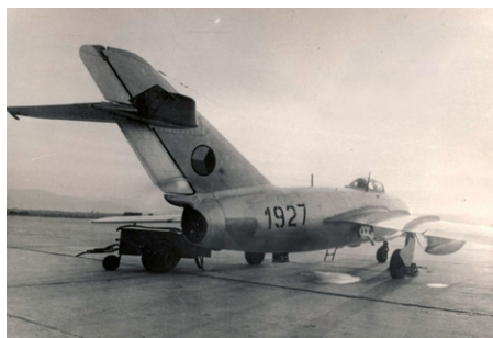
Ilustrační snímek MiGu-15.

Padesátá léta minulého století byla dobou tzv. studené války, kdy proti sobě stály dva znesvářené tábory. Naše země se ocitla v tom východním a podle toho byla budována i její armáda. Letectvo bylo masivně přezbrojováno zejména tehdy moderními proudovými letouny MiG-15, jejichž počet nakonec dosahoval mnoha set kusů. Situace došla tak daleko, že se počtu letounů přizpůsoboval i počet leteckých útvarů a vojenských letišť. Letadel bylo zkrátka tolik, že se pro ně musely budovat nové základny. V tomto období bylo rozhod-