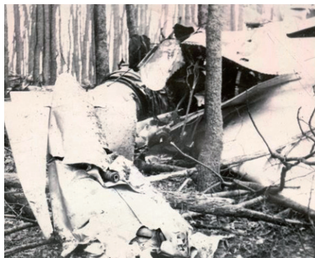
Levá přídatná nádrž – zadní část trupu.

zátáčku pod úroveň obou hřbetů tohoto údolí. Vedoucímu dvojice se podařilo v malé výšce průlet dokončit. Nadporučík Rostislav Minks v levé zátáčce před tímto průletem překlonil zátáčku do maximální hodnoty na záda, kde při srovnání do normální polohy sklouzl po křídle a pro nedostatek výšky narazil do protisvalu asi padesát metrů pod vrcholem kopce s kótou 386,6 m n. m. Náraz v rychlosti 500–550 km.h -1 pod úhlem 10° letoun zcela zničil. Pilot v malé výšce při maximálním náklonu neměl možnost použít záchranný padák, ani nestihl provést pokus o katapultáž.