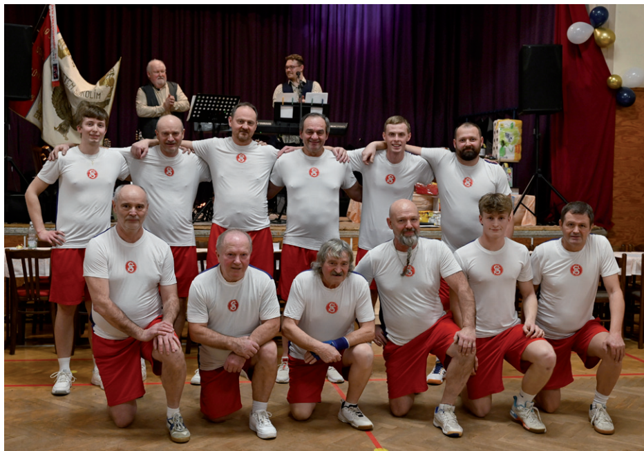
Reprezentační ples T. J. Sokol Silůvky, 18. ledna 2025.