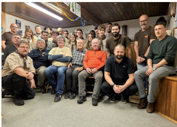
Vánoční schůzka oddílu Sokolík, 21. prosince 2024.