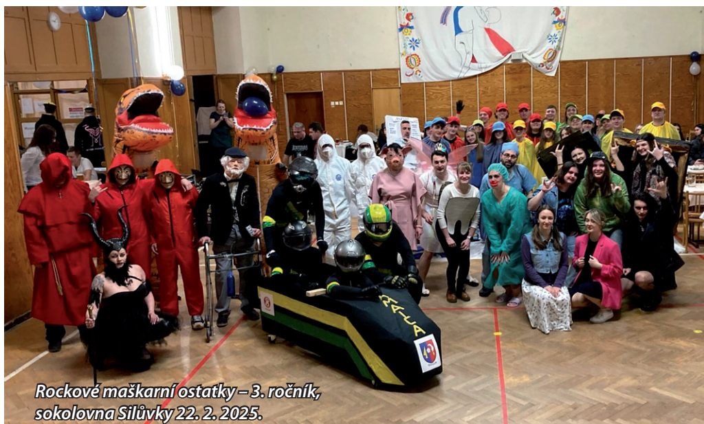
Rockové maškarní ostatky – 3. ročník, sokolovna Silůvky 22. 2. 2025.