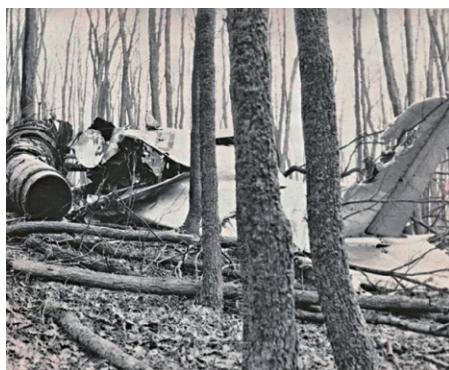
Zadní část trupu s ocasioní plochami a zadní část motoru s výtokovou rourou.