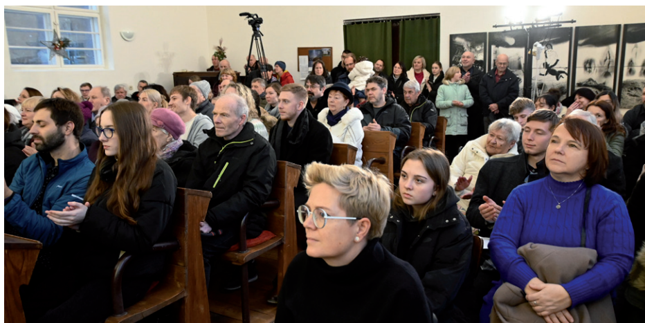
Štědrovečerní bohoslužba s dětskou vánoční hrou, 24. prosince 2024.