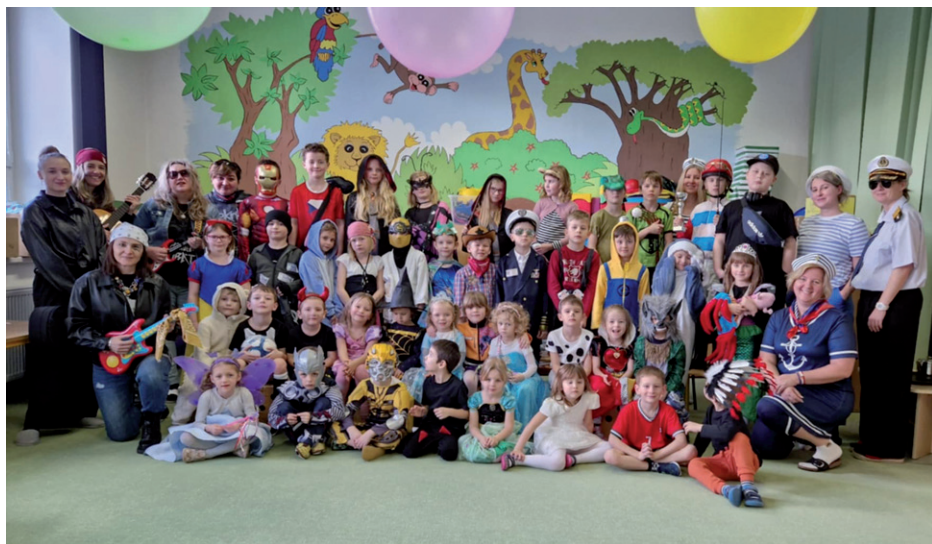
Maškarní den v MŠ a ZŠ Silůvky, 24. února 2026.