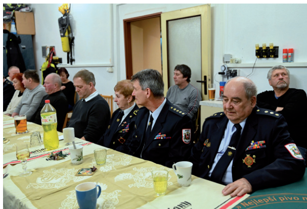
Valná hromada SDH Silůvky, Hasičský dům, 11. ledna 2025.