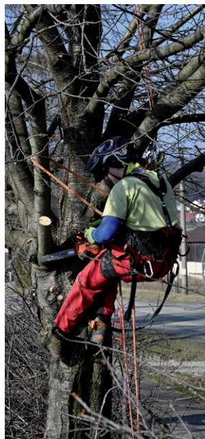
Prořez lipové aleje u hřbitova.