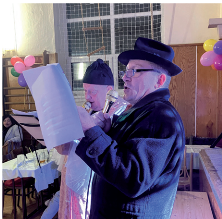
Rockové maškarní ostatky, 28. února 2026.