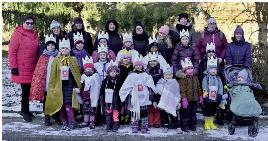
Společné foto koledníků Tříkrálové sbírky, 3. ledna 2026.