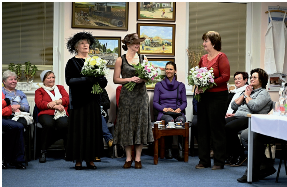
Prvorepubliková módní přehlídka, 20. ledna 2026.