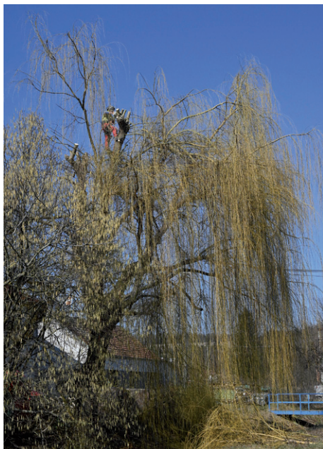
Prořez smuteční vrby na Trávníkách.