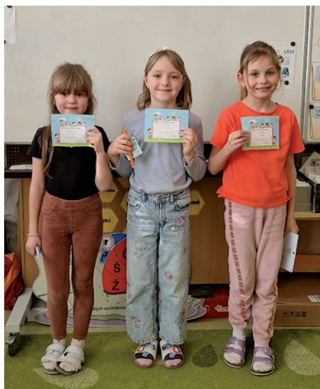
Recitační soutěž – 2. ročník.