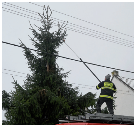
Ořez smrku na ulici Nádražní.