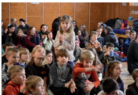
Zimní stopou okolo Silůvek – 47. ročník, 10. ledna 2026.