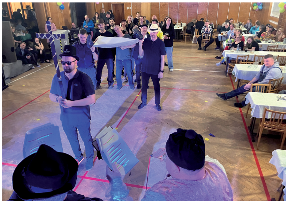
Rockové maškarní ostatky, 28. února 2026.