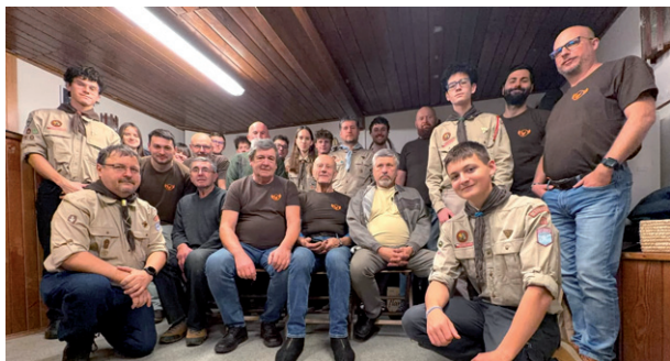
Vánoční schůzka oddílu Sokolík, 20. prosince 2025.