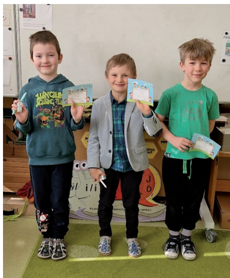
Recitační soutěž – 1. ročník.