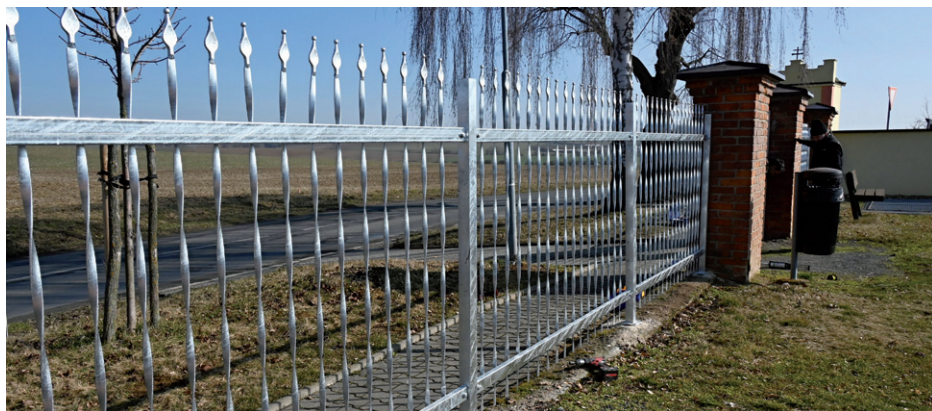
Výměna zbývající staré již nevyhovující levé části oplocení hřbitova i s montáží nové brány.