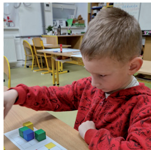
Zápis dětí do ZŠ, 28. ledna 2026.