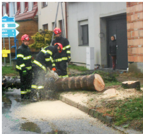
Kácení smrku na Anenské ulici.