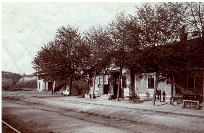
Jedna z nejstarších fotografií nádraží v Silůvkách, foto Karel Katholický, 1890.