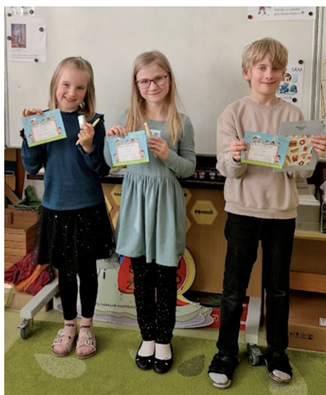
Recitační soutěž – 3. ročník.