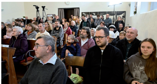
Štědrovečerní bohoslužba s dětskou vánoční hrou, 24. prosince 2025.