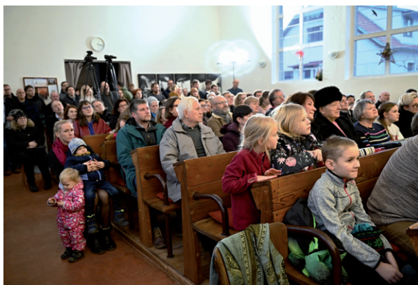
Štědrovečerní bohoslužba s dětskou vánoční hrou, 24. prosince 2025.