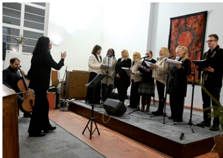
Koncert komorního souboru, 10. ledna 2026.