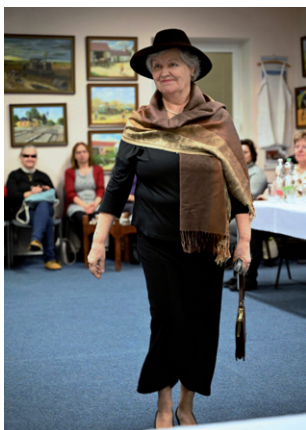
Prvorepubliková módní přehlídka, 20. ledna 2026.