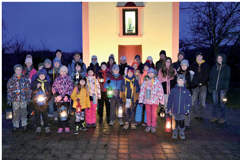
Členové skautského oddílu Sokolík při roznášení Betlémského světla, 23. prosince 2025.

Zvláštní poděkování patří také dětem, které se do roznášení světla zapojily s nadšením a odhodláním, a nenechaly se odradit ani mrazivým počasím či občasným deštěm. Právě jejich nasazení a ochota pomáhat jsou tím nejkrásnějším důkazem, že myšlenka skautské služby druhým žije dál a předává se nové generaci.