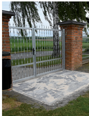
Parková úprava plochy rozptylové loučky a dlažba před bránou na hřbitově, květen 2026.