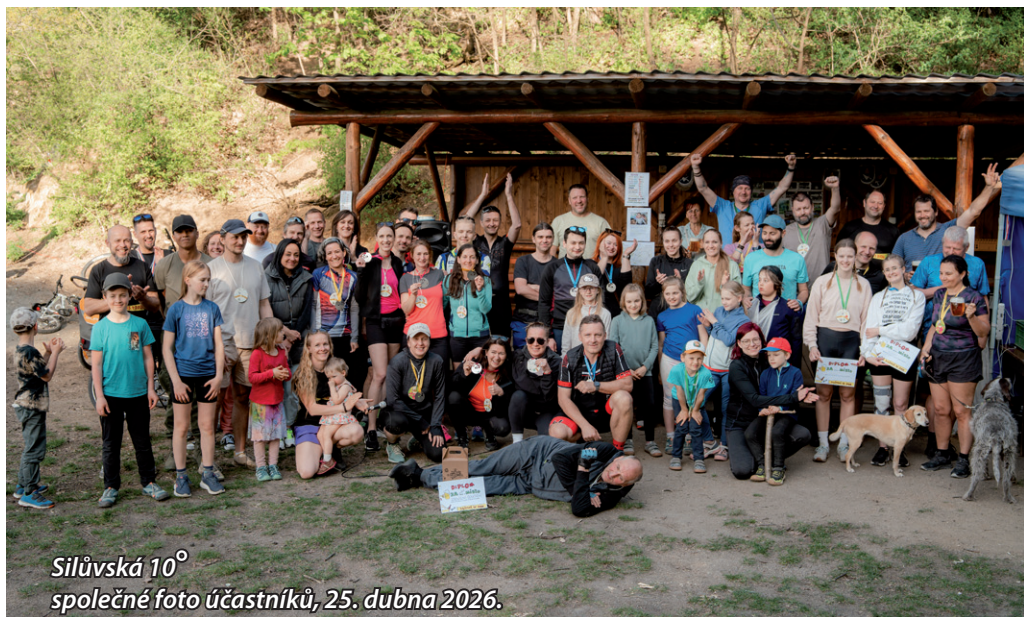
Silůvská 10° společné foto účastníků, 25. dubna 2026.