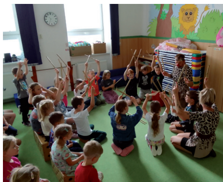
Den dětí v naší školičce, 1. června 2026.