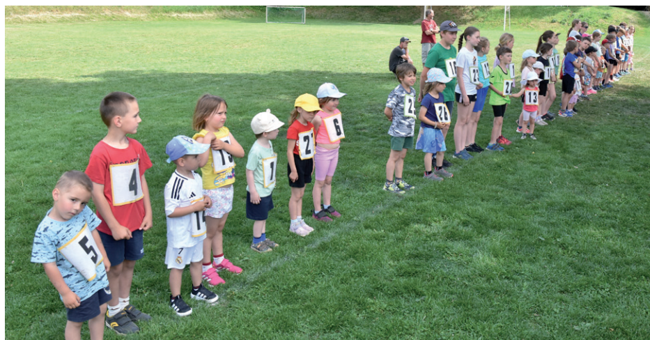
Atletický čtyřboj, 1. června 2025.