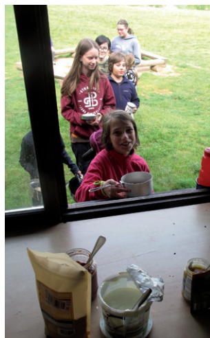
Jarní výprava do Čachnova, 8.–10. května 2026.