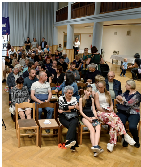
Besídka k Svátku maminek, 7. května 2026.