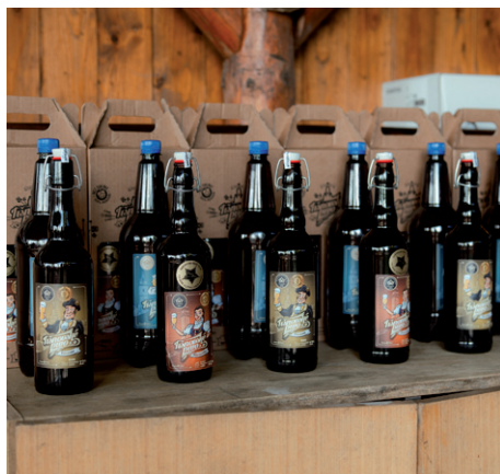
Silůvská 10°, 25. dubna 2026.