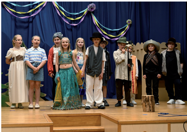
Besídka k Svátku maminek, 7. května 2026.