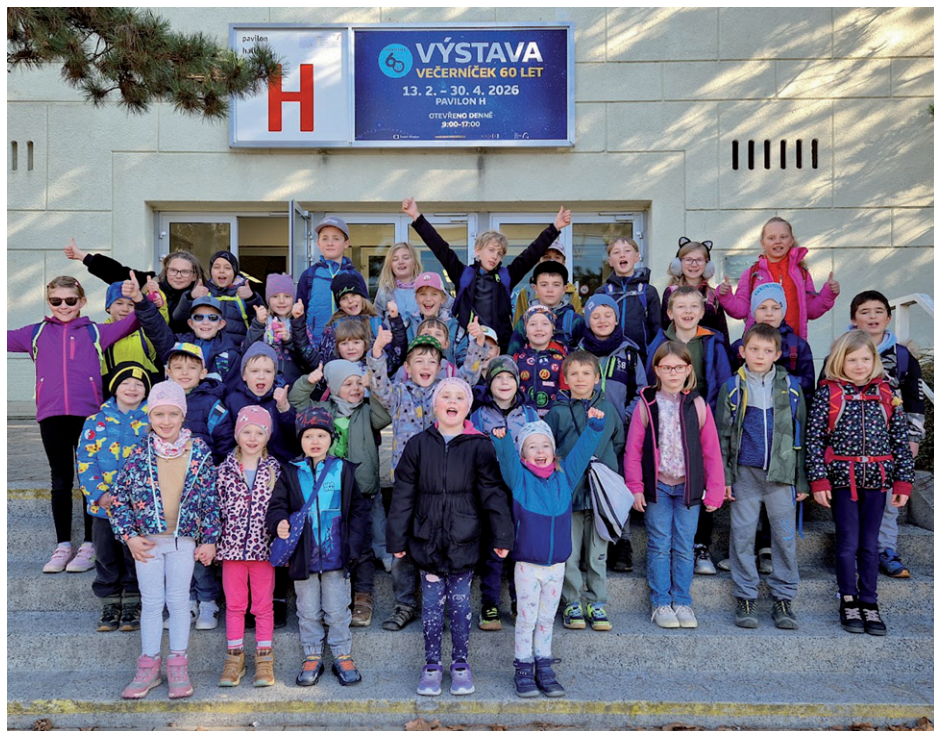
Návštěva výstavy Večerníček slaví 60 let.