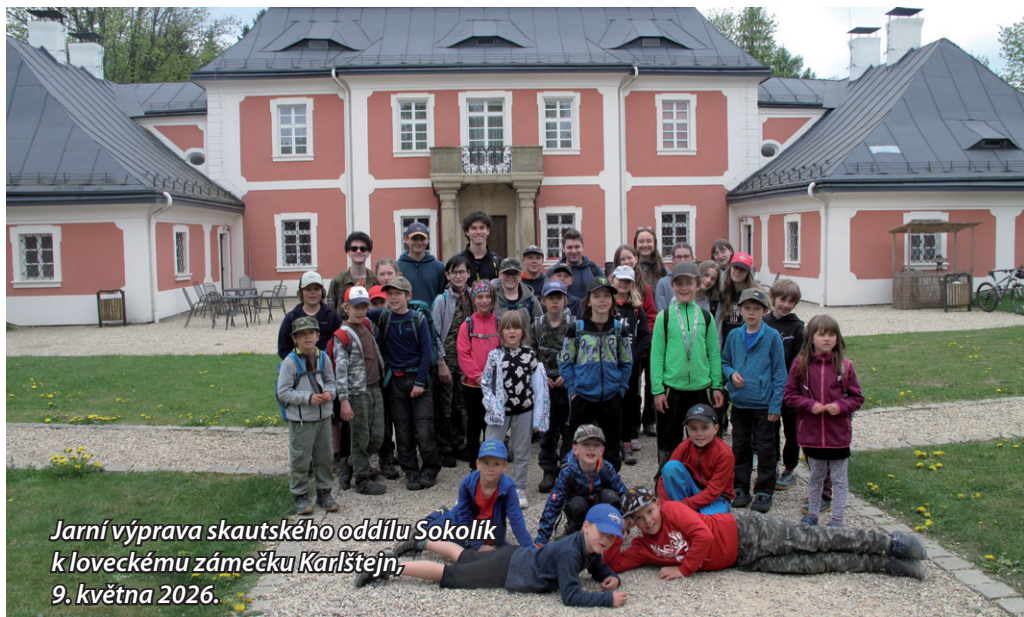
Jarní výprava skautského oddílu Sokolík k loveckému záměčku Karlštejn, 9. května 2026.