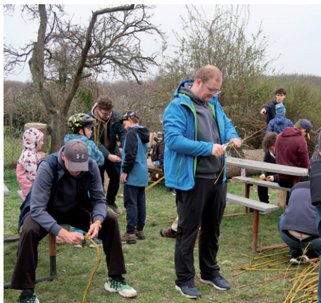
Velikonoční schůzka, 4. dubna 2026.