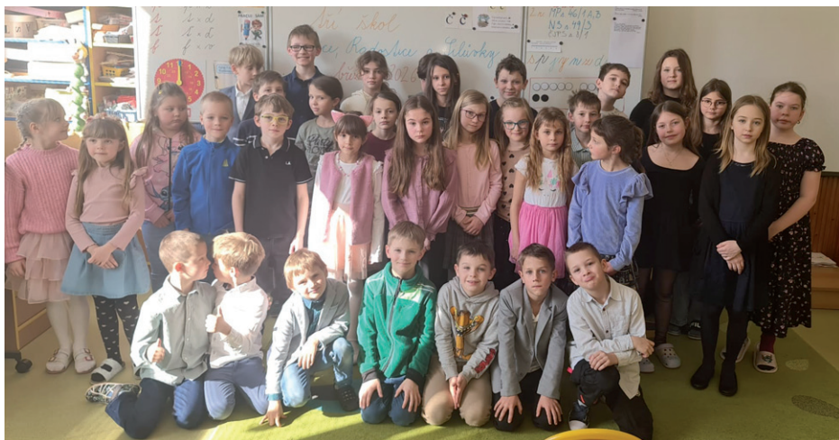
Společná fotografie všech účastníků recitační soutěže tří škol, 11. března 2026.