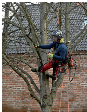
Pokračování ořezu stromů v obci, březen 2026.