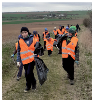
Uklidíme Silůvky a okolí, 28. března 2026.