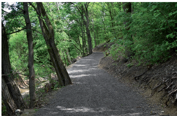
Dokončení cesty pod Horkou směrem k Salaši, květen 2026.