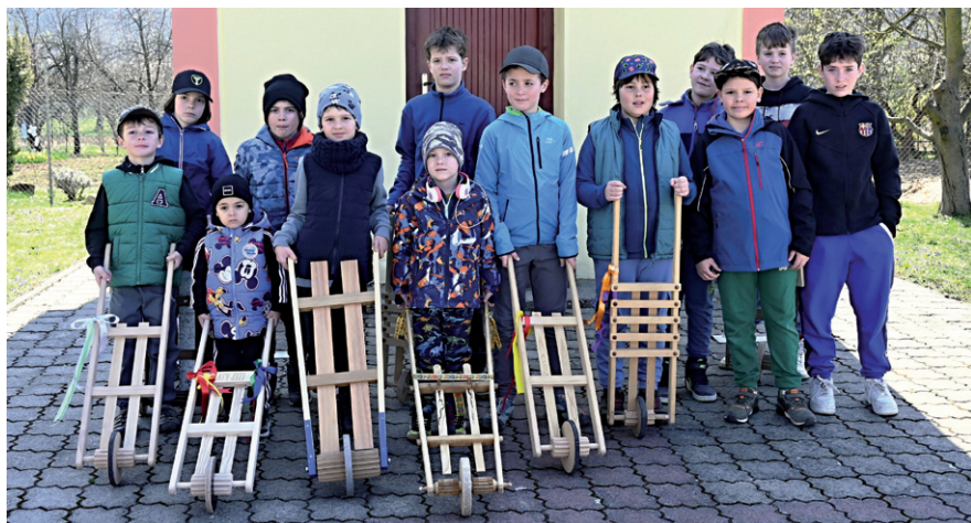
Parta kluků při tradičním velikonočním hrkání před zvonící sv. Anny.