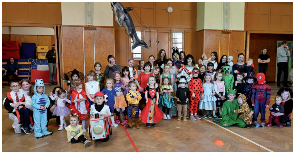
Dětský maškarní karneval, 15. března 2026.