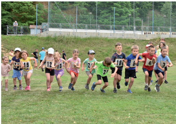
Atletický čtyřboj, 1. června 2025.