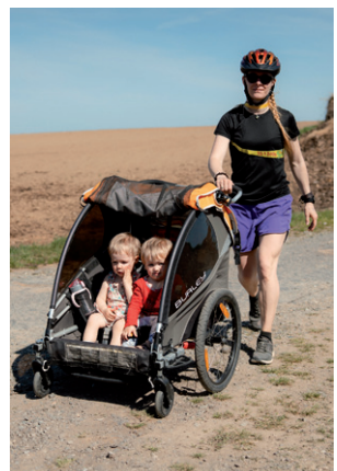
Silůvská 10°, 25. dubna 2026.