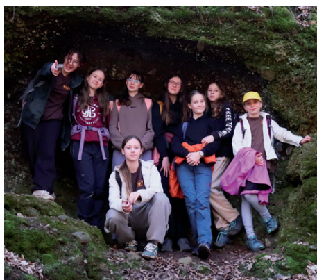
Rozpůlená březnová výprava, 7. března 2026.