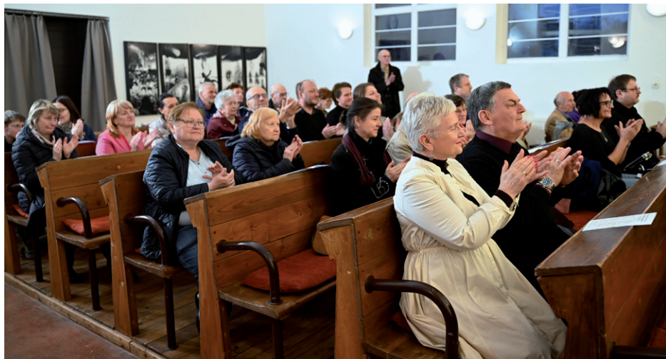
Koncert duchovní hudby, 15. března 2026.