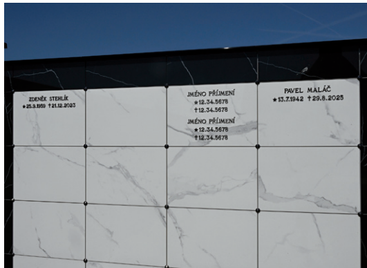
Nové kolumbárium na hřbitově je již funkční.