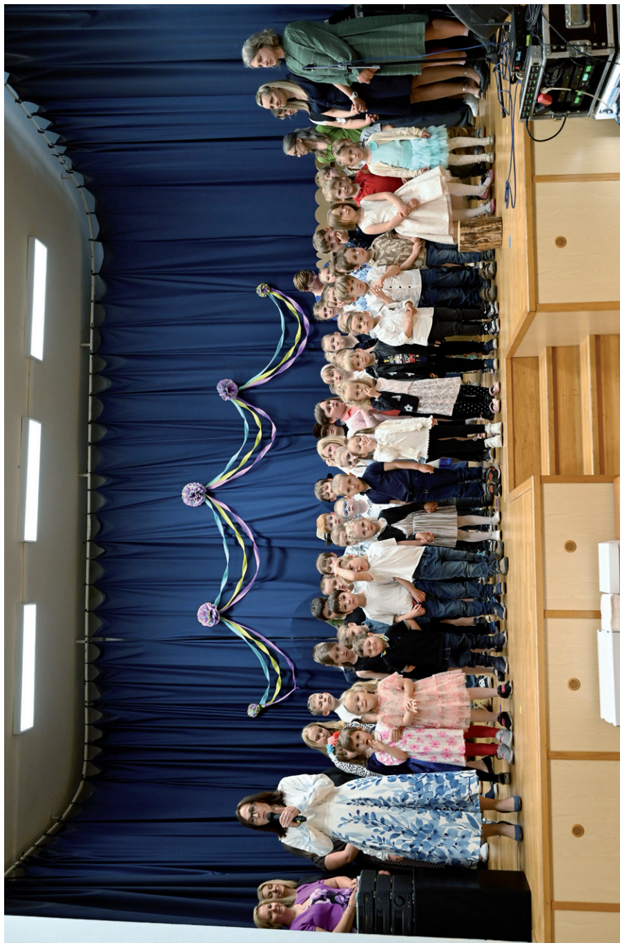
Besídka k Svátku maminek, 7. května 2026.