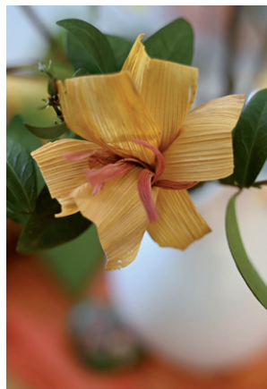
Jarní posezení se zdobením kraslic, 27. března 2026.