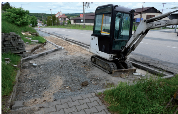
Oprava chodníku na konci ulice Sokolské směrem ke hřbitovu, květen 2026.