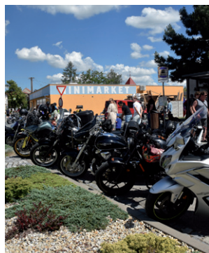
Motokolečko – XVIII. ročník, 6. června 2026.